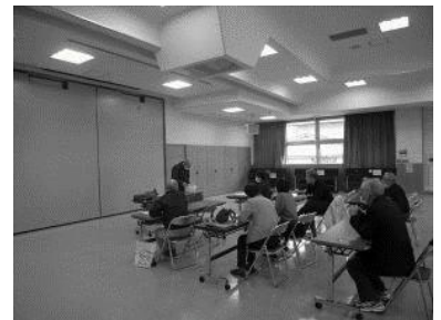
新会員への説明。 席を離して着席

また、総会后2週間(感染→発症→PCR検査結果まで要する日数)過ぎても感染者が出なかったのは、皆様のお陰で成果があったと思います。