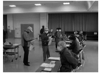
地区連絡員が代表で申込

今回の総会は会にとって初めての経験で、会則の総会・第5条2)項目で総会の決議を要するとあります。今年度は緊急事態につき以下の事項は総会資料に記載されている通りです。勝手ながら全員が賛同とさせていただきました。