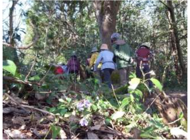
妙法寺散策：雪割草咲く日蓮さまの道