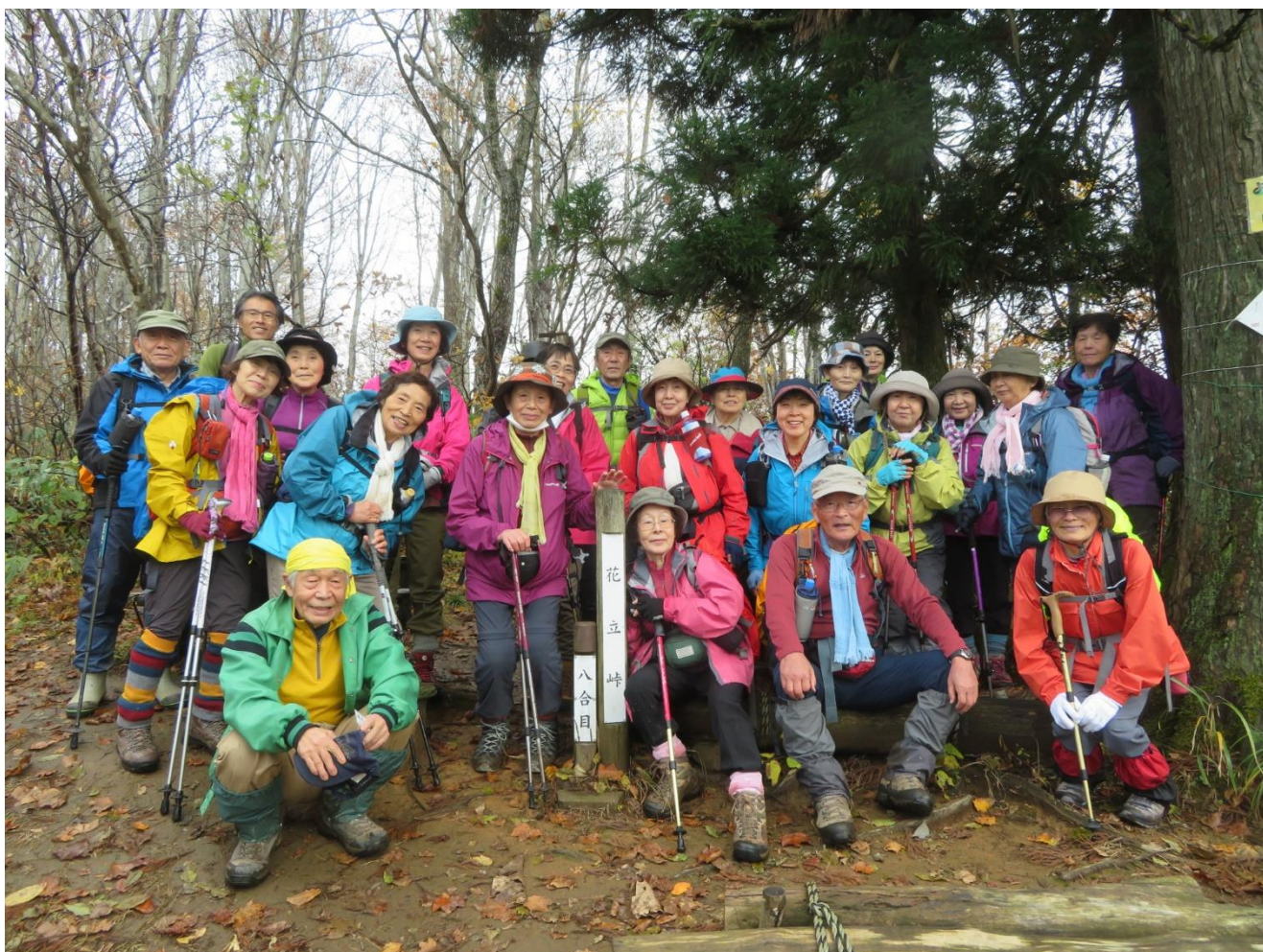
雨上がる。良かったね