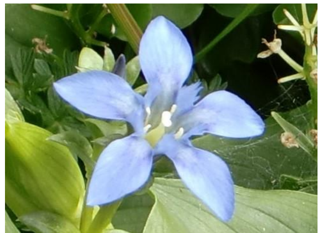
飯豊の星 エイデリンドウ

翌日も天気は良くお花咲く登山道を天狗岳を越え御手洗ノ池も過ぎ烏帽子岳、梅花皮岳も越え梅花皮小屋で昼ご飯を作ります。小屋のすぐ近くに水場があり豊富な水がパイプから出ていました。小屋の目の前は石転沢、何時か石転の雪渓を登ってみたいです。北股岳も越え門内小屋も過ぎ梶川尾根の分岐も過ぎ地神山を越し、地神北峰で丸森尾根とも別れ頼母木山も越し今夜の宿の頼母木小屋に着きました。この後俺に悲劇が待っていました。