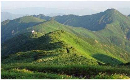
頼母木山から小屋を振り返る