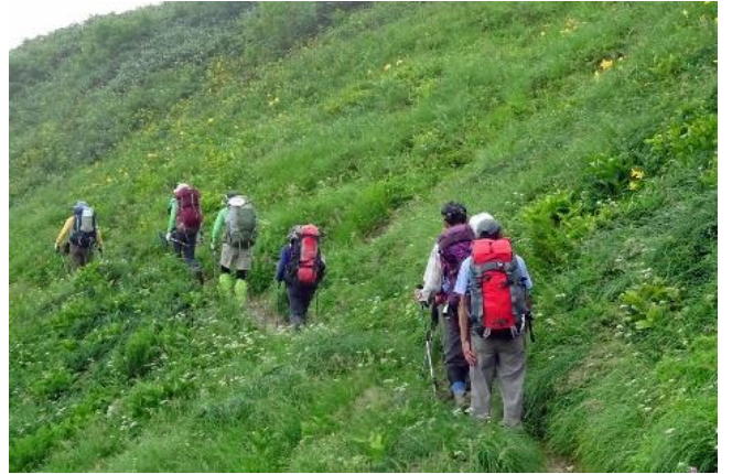
お花畑のへ吊り道