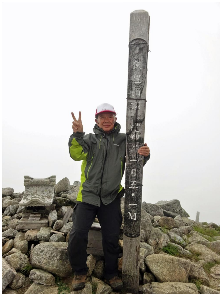
11回目の飯豊山 75歳でこれが最後かな

今年喜寿の記念に飯豊山に8月の終わりが9月に登る計画をしましたがコロナの感染が拡大し小屋泊りに成るので怖くて中止にしました。もう飯豊に登る事は無いでしょう。