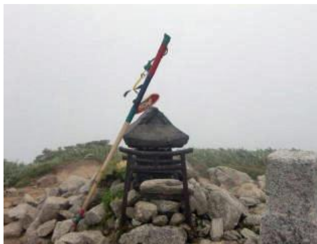
杵差岳（えぶりさしだけ）1636m

途中風を避けて昼ご飯を食べました。帰りのタクシーの時間に間に合う様に下山しました。この時期飯豊は暑さとの戦い持参した3リットル水は姫子の峰で500cc1本だけに成りました。何とかタクシーの時間に間に合う様に下山しました。