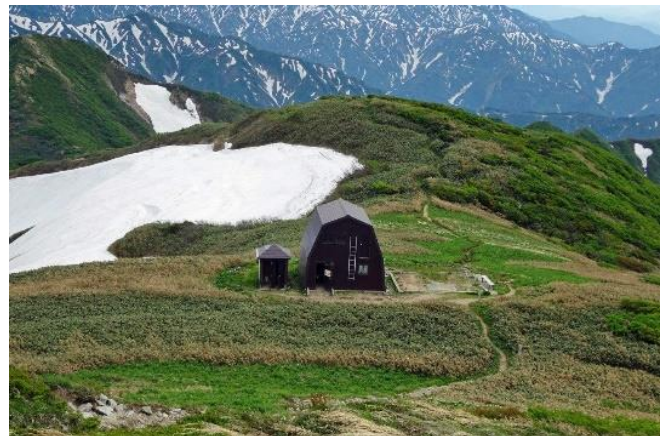
山頂から見た今晚の宿杵差小屋