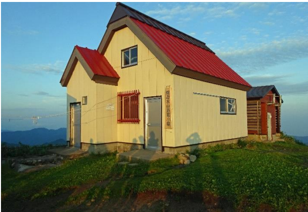
夕日に染まる頼母木小屋前で

飯豊に初めて登ったのは山登を始めたのが60歳と遅く61歳の時ハイキングクラブの山行飯豊縦走に参加したのが初めてです。リーダーは当時の会長のAさんでサブリーダーは幹事のKさんでした。参加者は私を入れて男性5人ジャンボタクシーで今は通行禁止の小白布沢の登山口迄入り横峯小屋跡で御沢キャンプ場からのコースに合流、剣ヶ峰の岩稜を越え三国岳の小屋で休憩します。時期は飯豊の花の綺麗な7月の終わりお天気にも恵まれ途中の駒返しの岩場も過ぎアップダウンの尾根道を過ぎ今晚の宿の切合の小屋に到着、