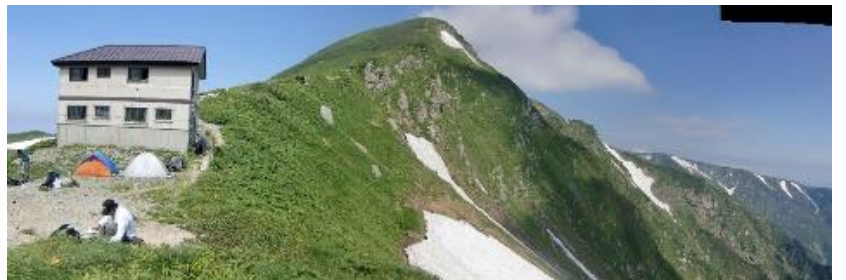
梅花皮小屋と北股岳