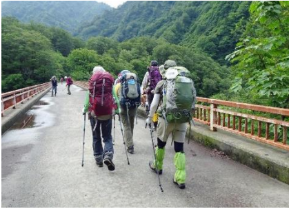
飯豊最後の縦走で会山行に参加