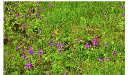
ハクサンコザクラ