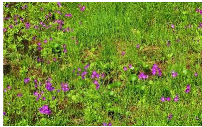
ハクサンシオガマ