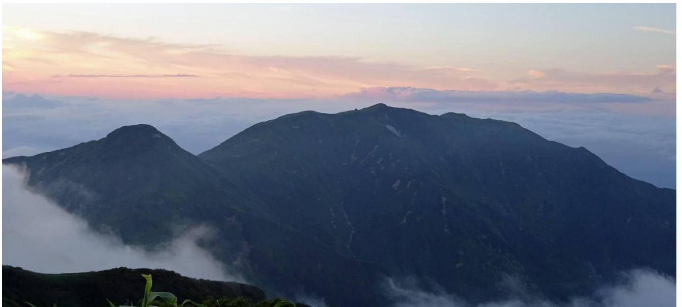
夕日を見ながら酒を飲み。その後が大変でした

せん。途中の足の松尾根での昼休憩の時少し水も飲めるようになりカロリーメイトも少し食べられました。足の松の急な尾根を二日酔いで殆ど飲まず食わずで下山し林道を奥胎内ヒュッテー迄地獄の行軍でした。ヒュッテーの風呂に入り体重を計ったら4,5キロ減って居ました。皆さん方は風呂上りにビールを美味しそうに飲んで居ましたが俺はアルコールの匂いを嗅ぐのも嫌に成って居ました(その日だけ)3日目迄はお天気に恵まれ綺麗に咲いた花を見、雄大な景色を眺め天国でしたが最後の4日目は地獄でした。