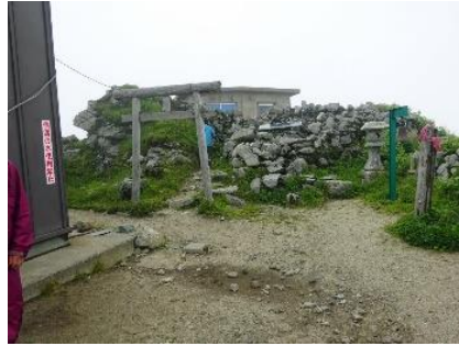
本山小屋と飯豊神社