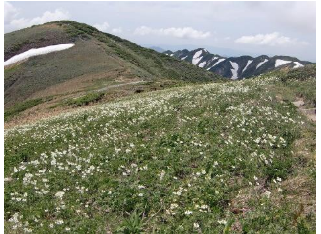
ハクサンイチゲの群落