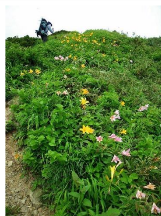
花咲く中を北股岳へ