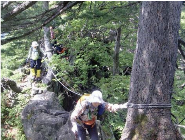
足の松尾根の岩場

の分岐の雪渓で水が取れました。イチジノ峰で昼休憩しました。大石山の杵差岳への分岐から頼母木山に向かう登山道には色々な花が咲いて居てハクサンイチゲの群落は見ごたえが有ります。ゆっくりお花を楽しんで6年前酒を飲みすぎた嫌な思い出の有る頼母木小屋に着き寝る場所を決めて頼母木山に登ります。