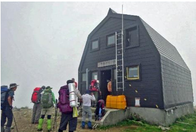
今晚の宿は御西小屋