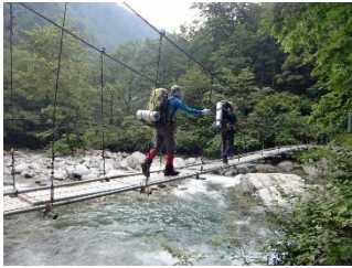
桧山沢の吊り橋を渡る