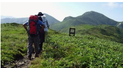
ギルダ原の熊の檻