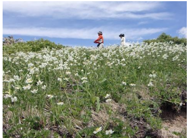
ハクサンイチゲ咲く中を

頼母木の小屋は未だ管理人も居ず水も引いてありません。雪渓の雪を溶かして食事用の水や飲み水を作ります。夕食を食べ杵差方面に沈む夕日を見に出ますが外は寒いです。女性は1階で俺は2階で