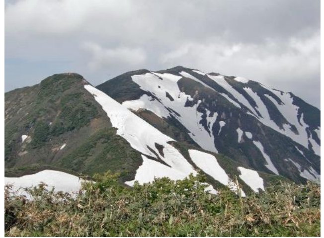
これから歩く鉾立峰と杵差岳