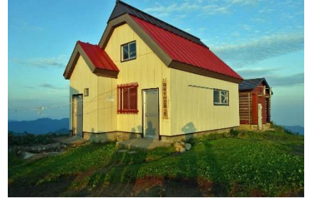
頼母木小屋で宿泊