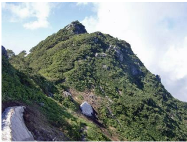
ダイグラ尾根の核心宝珠山

と飯豊山でした。先行の二人はこの時間に御西の小屋に着いて居たそうです。持参の水も此処で飲み干し後は水なしで御西の水場迄、夕方で涼しく何とか歩けました。飯豊山から御西岳の間は花の満開の楽園、苦しさが有ればその先の楽しみは倍増です。咲く花に癒され水場に寄り御西の小屋に着きました。計画では此処まで 11 時間 30 分、実際は 14 時間掛かりました。小屋は満員ですが先行の 2 人が場所は確保して有りますが周りは暗くなり小屋の中での食事は他の人の迷惑に成るので外でヘッドランプの明かりを頼りに宴会、食事の後静かに小屋の中に入りました。中は暑く寝袋無しで寝ました。