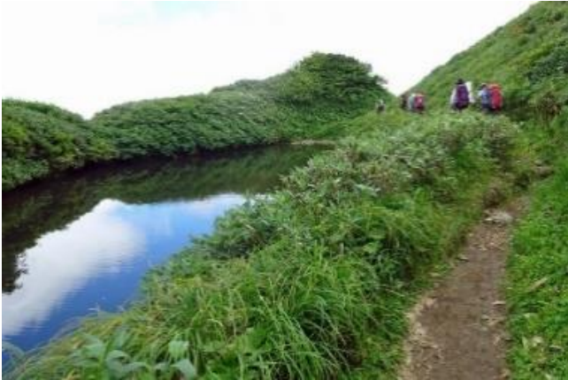
御手洗の池を過ぎ