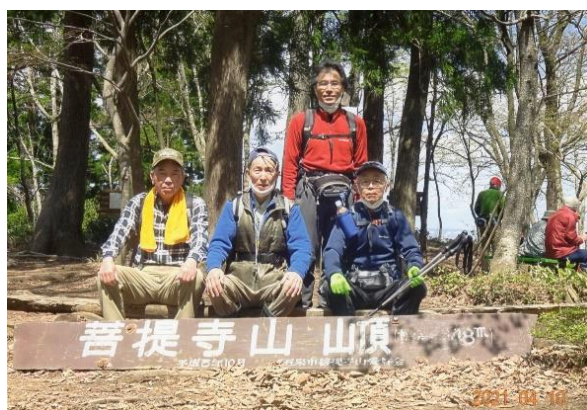
菩提寺山山頂 248m にて