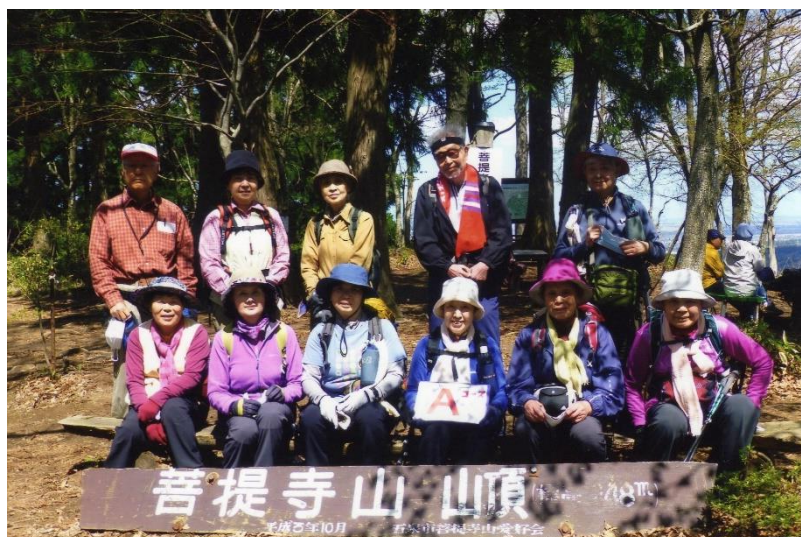
菩提寺山山頂 248m にて