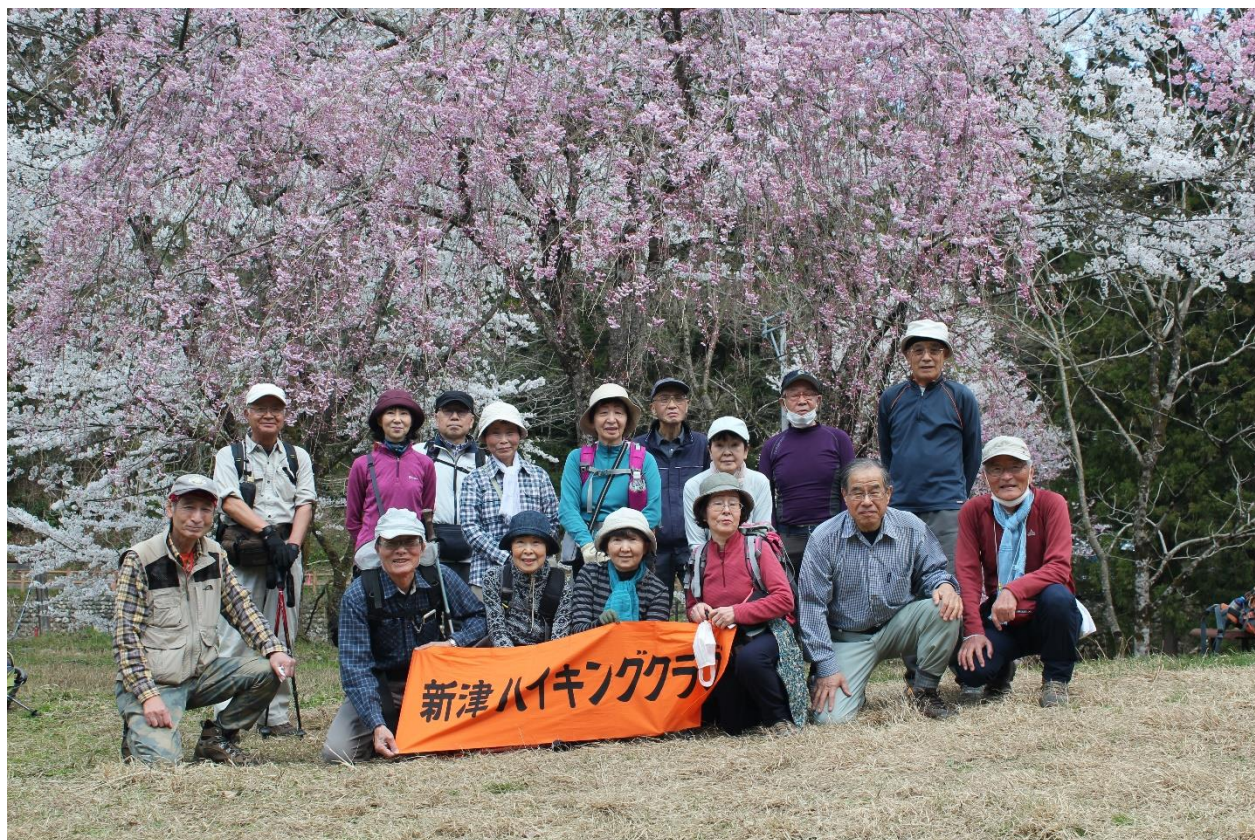
満開の桜の下で記念撮影 大沢公園にて