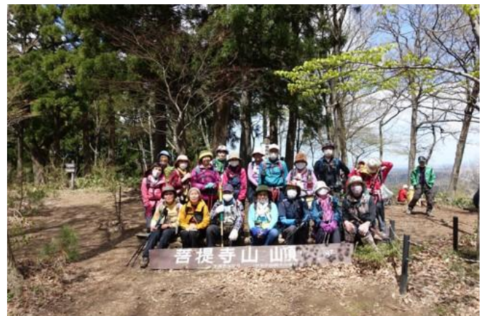
菩提寺山山頂 248m にて