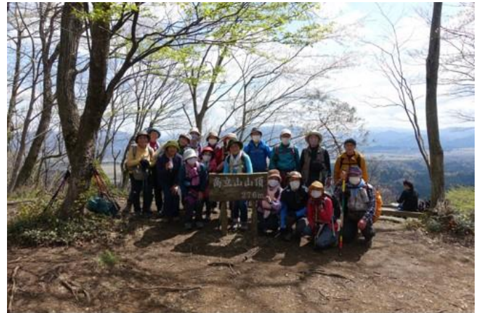
高立山山頂 274m にて