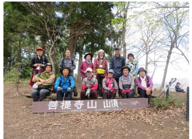
菩提寺山山頂 248m にて