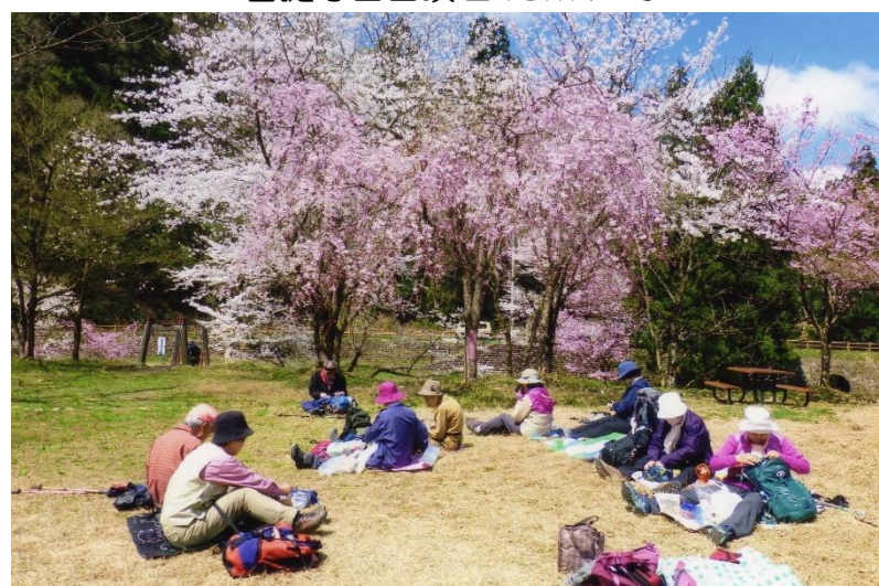
満開の桜の下で大きな輪になって昼食を摂る