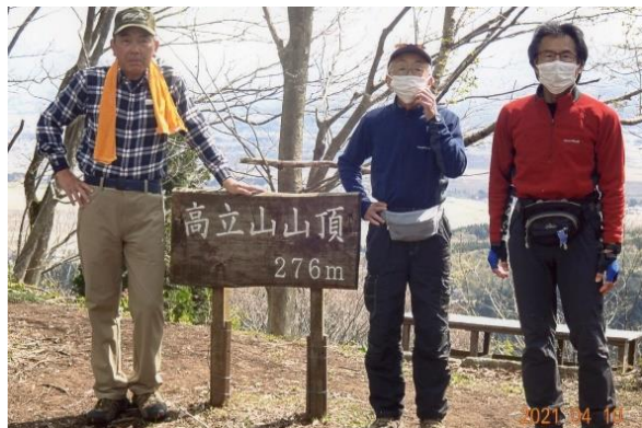
高立山山頂 274m にて