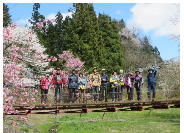
満開の桜と吊り橋 大沢公園にて