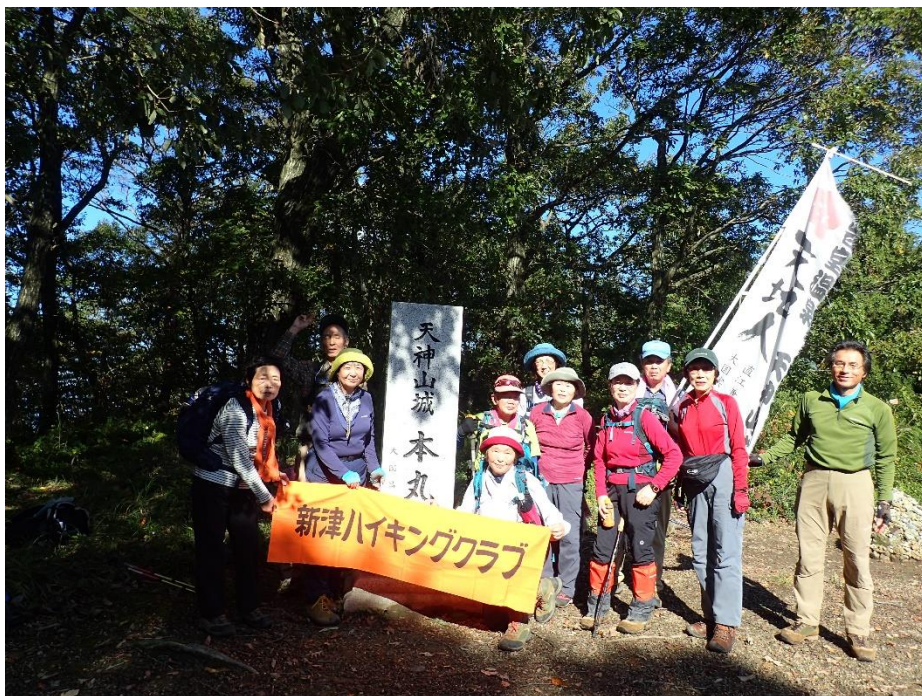
天神山城址 本丸跡にて