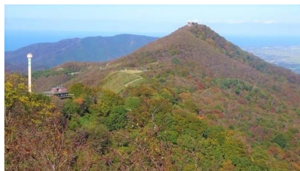
弥彦から多宝山を望む