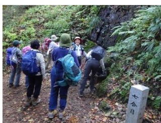
御神水でのどを潤す