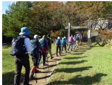
丸小山公園より天神山へ