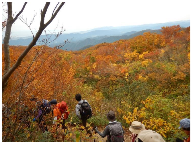
紅葉の山を眺めながら歩く