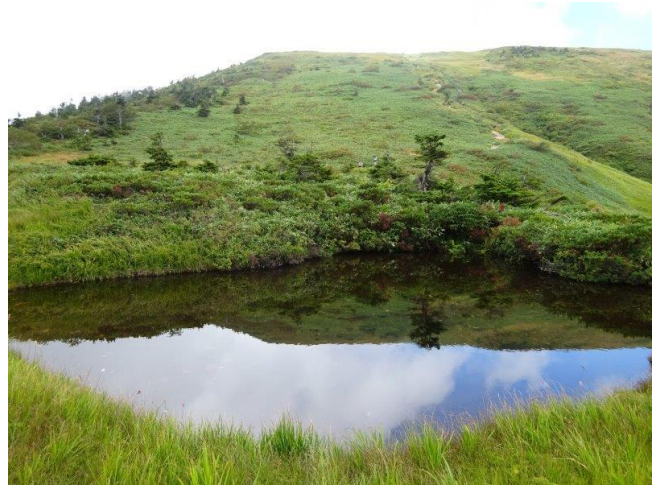
織姫の池に写る巻機山