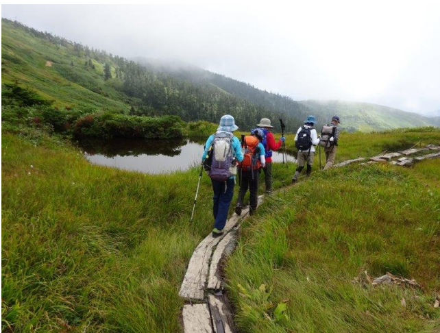
織姫の池の横を通り