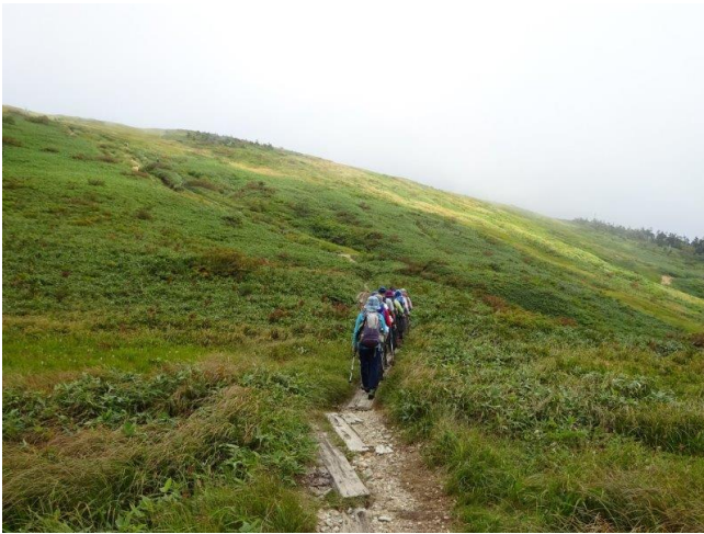
山頂へ最後の登り