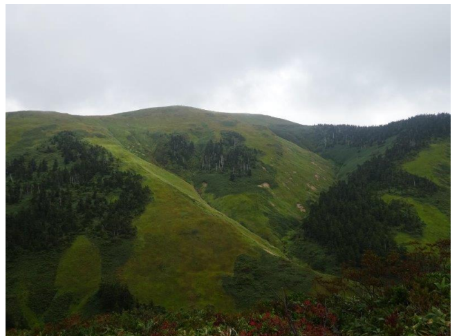
九合目から見る巻機山