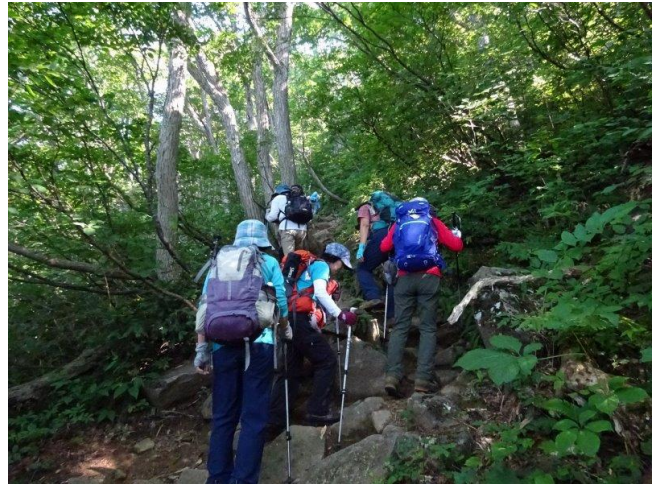
風のないブナ林の登り、汗が噴き出します