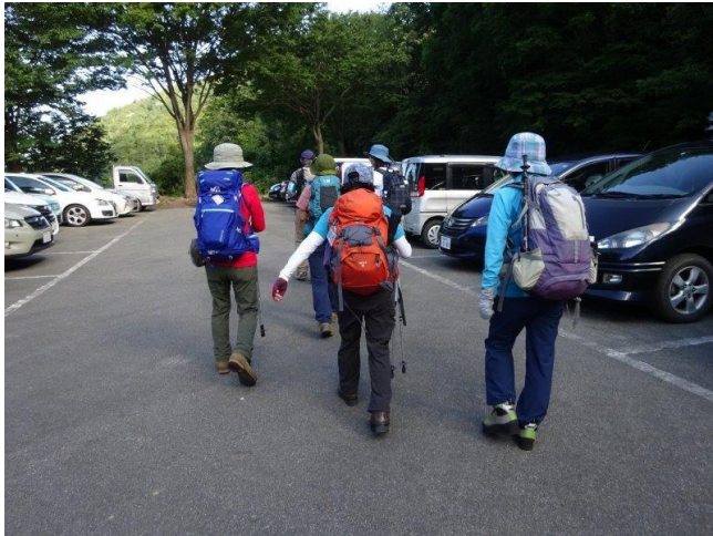
日曜日どの駐車場も車々

https://ameblo.jp/hiking1315/entry-12525882370.html