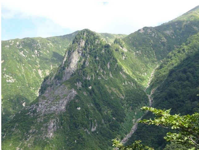
六合目からの天狗岩