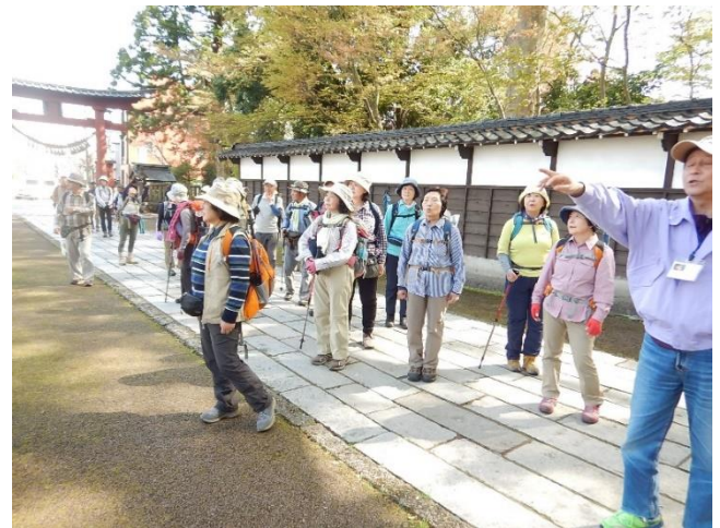
ボランティアガイドによる説明