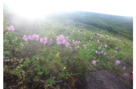
ハクサンコザクラ