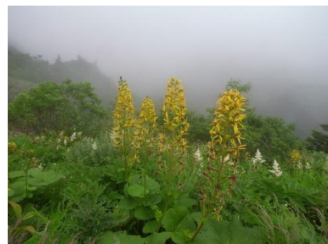
十二曲がりの花畑

朝食が済み、今日も真っ青な空の下軽快に下山スタート。『黒ボコ岩』からは、観光新道へハイマツの登山道を過ぎると、え〜っ！一面の花畑ではありませんか！テンションが高くなります♥何と言ひ表せばいいのでしょうか。