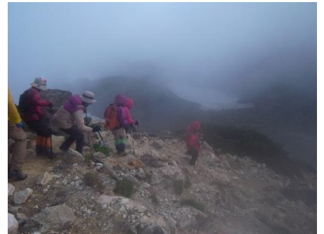
山頂の火口湖巡りガレ場に注意