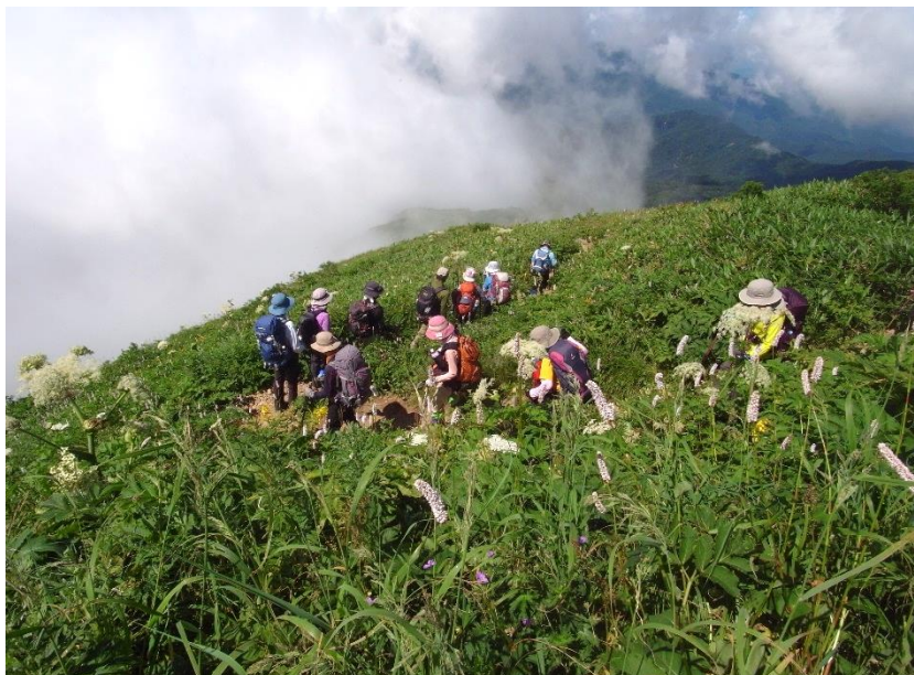
観光新道は花畑を下る