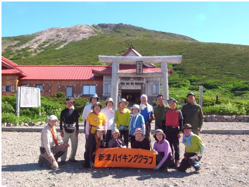
白山室堂にて（白山奥宮と御前峰 2,702m を背にして）