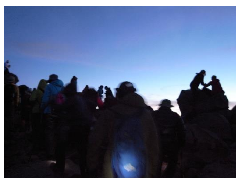
夜明け御前峰山頂に到着