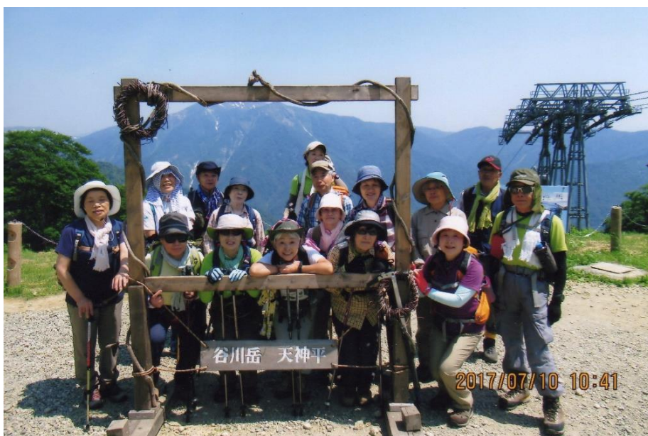
天神平山頂駅にて