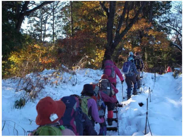
陽光に輝る秋色と新雪道