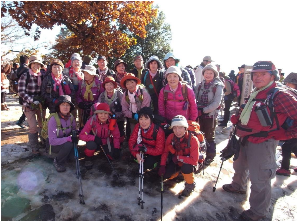
高尾山頂上 599.5m にて