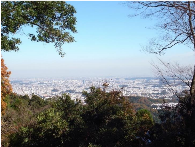
リフト駅上からの東京都心