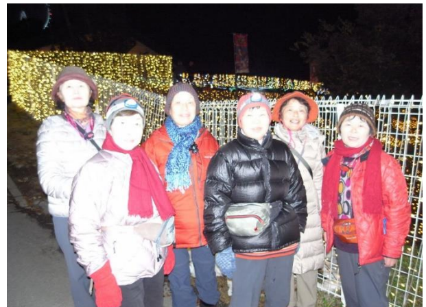
イルミリオンにて1班のみなさん