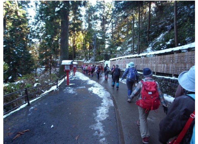
一号路参道から薬王院に向かう