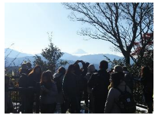
山頂の富士見にて