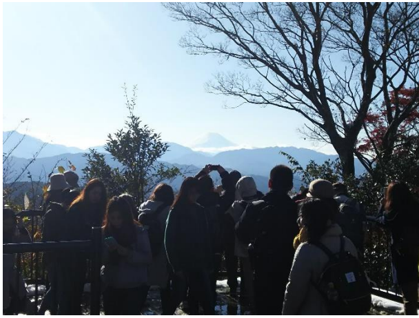
逆光の富士「関東の富士見 100 景」