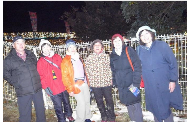
イルミリオンにて3班のみなさん