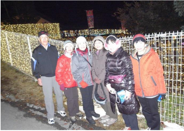
イルミリオンにて2班のみなさん