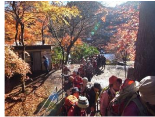
リフト麓駅の紅葉

次は「さがみ湖イルミリオン」です。光の海、動物園、ナイアガラ、などテーマごとに輝き飾られています。あまりの広さに迷子にならないように順路にそって見て回り帰路につきました。楽しかったです。L SL、参加した皆さん、お世話になりました。感謝です。