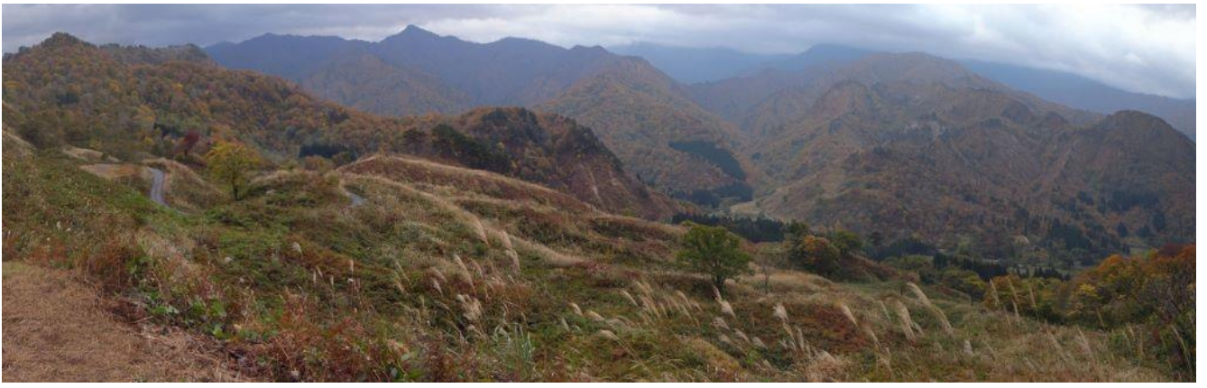
樽口峠からの全景