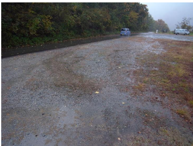
雨脚が強くなり、温身平へ向かう