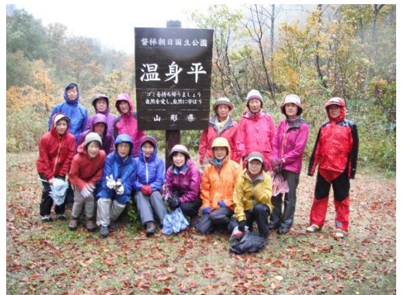
磐梯朝日国立公園・温身平