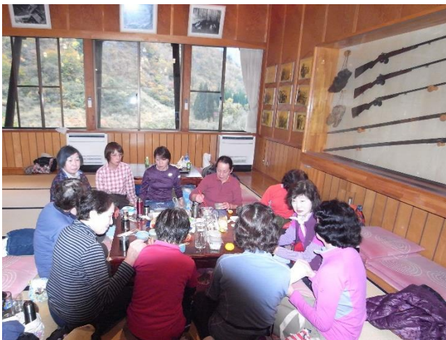
身体を温め、談話に花が咲く昼食時間