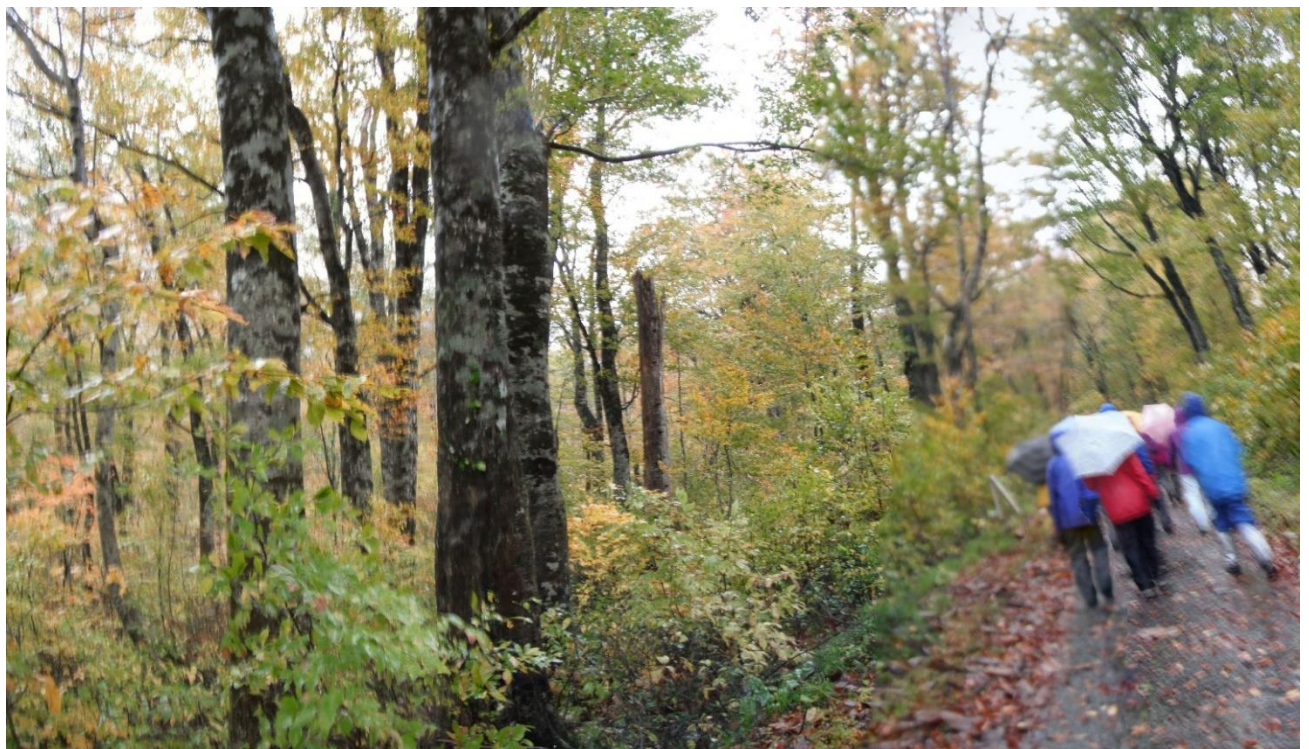
秋が深まりブナの紅葉の中を歩く