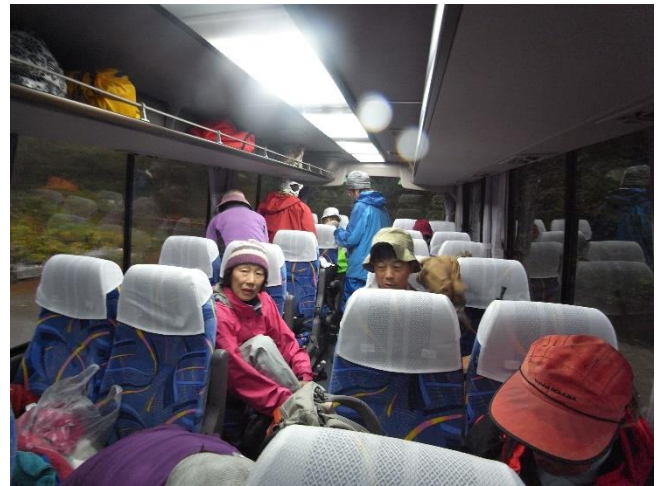
車中で雨具を付け準備