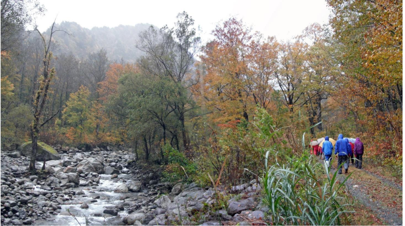
玉川脇の散策路を歩く。ヤチダモの巨木に出会えた。