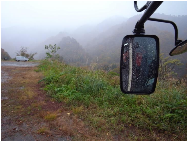
倉手山登山口に到着すると本降りの雨