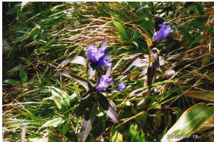
青紫の鮮やかなリンドウ

スキー場近くなると土が滑るので、皆注意しながら下ったため、全体に時間が遅れてリフトを使わず自力でスキー場を下りました。リフトを使ったらコスモスの花のピンク、黄色等々の色とりどりの花が見られたらと一寸残念でした。いずれにしろ、全員無事に完登できたことが何よりもうれしく思い、黒姫山に登られて満足しました。ありがとうございました。