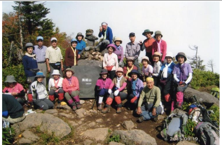
信濃黒姫山々頂 日本二百名山、北信五岳の一つ 西側に日本百名山の高妻山がくっきり