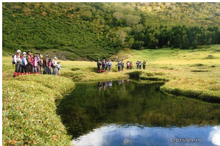
山頂西側下の七ツ池と湿原 向って左側上方が黒姫山頂 乾燥化が進行し、低い笹に覆われていた