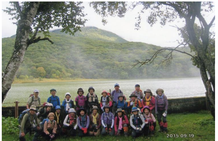
古池越しに黒姫山の全容・実際の山頂は奥の方。湖岸にはサラシナショウマ、トリカブト等の群生