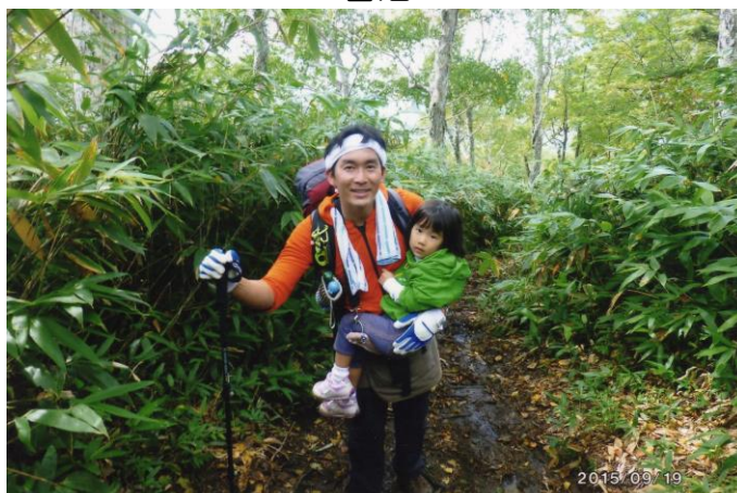
親子連れの登山者に会う