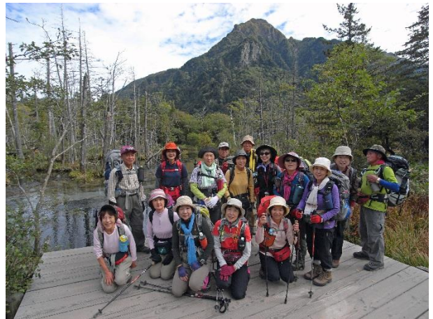
梓川右岸自然探勝路 背景は六百山