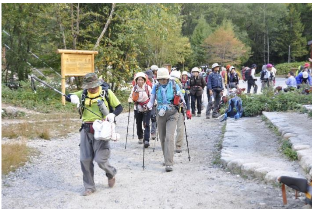
横尾から長い林道歩き