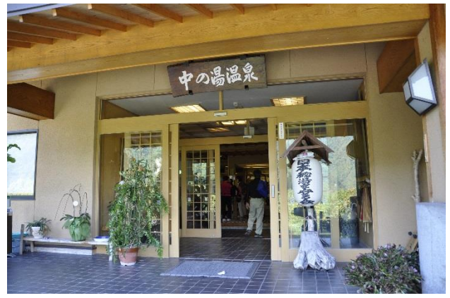
中の湯で入浴と蕎麦