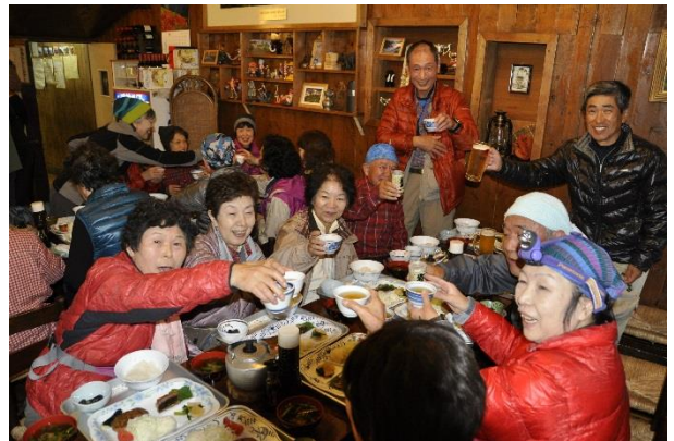
夕食 17 時、また乾杯