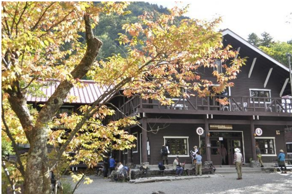
「氷壁」で有名な徳沢園