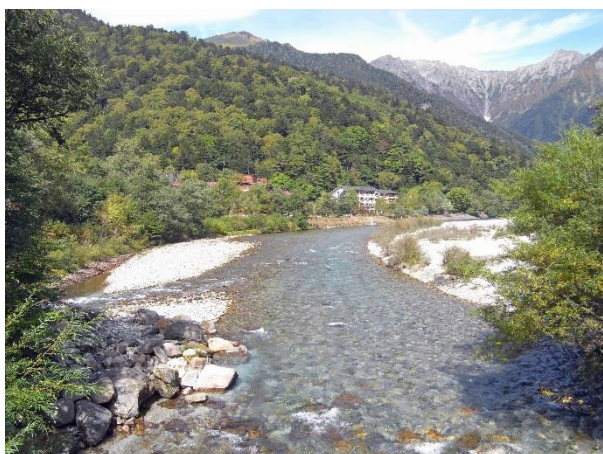
田代橋から梓川越しに穂高を望む