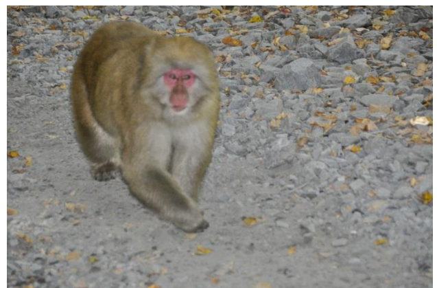
熊に追われた猿軍団に遭遇