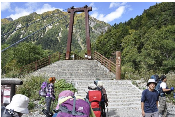
横尾吊橋。これから本格的な登りだ