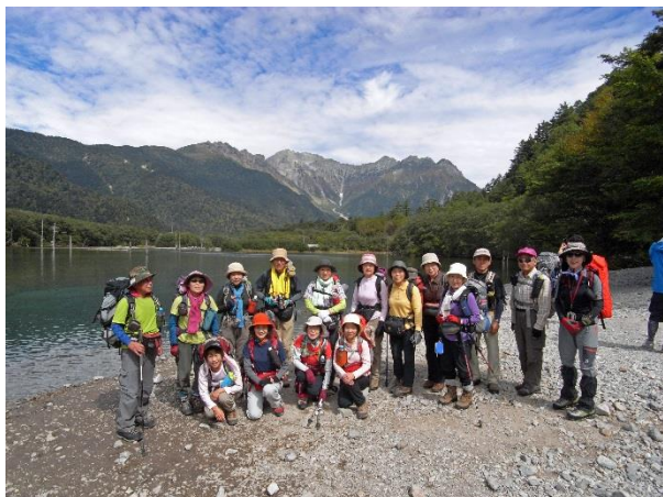
大正池 背景は穂高