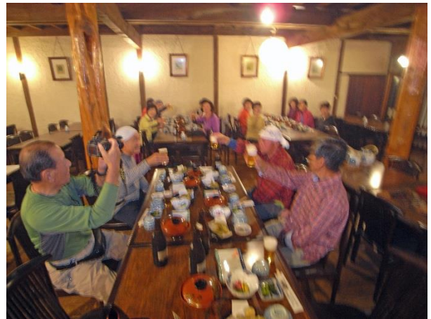
生ビールなしの楽しい夕食 ((+_+))