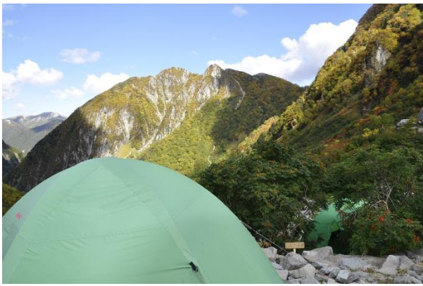
カールから屏風ノ頭