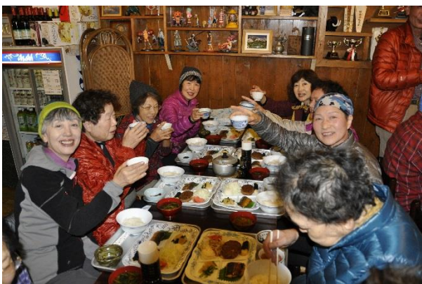
夕食 17 時、また乾杯