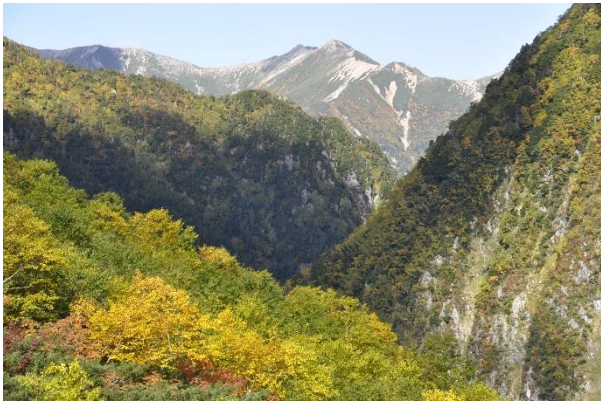
午後の陽に照らされる常念岳