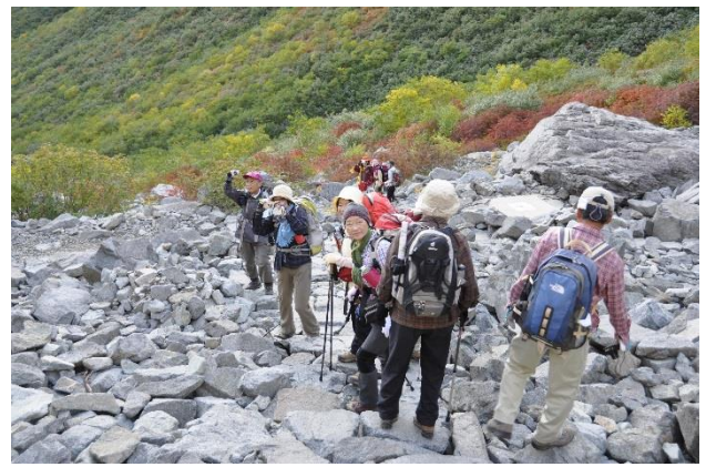
名残り欲しく振り返る