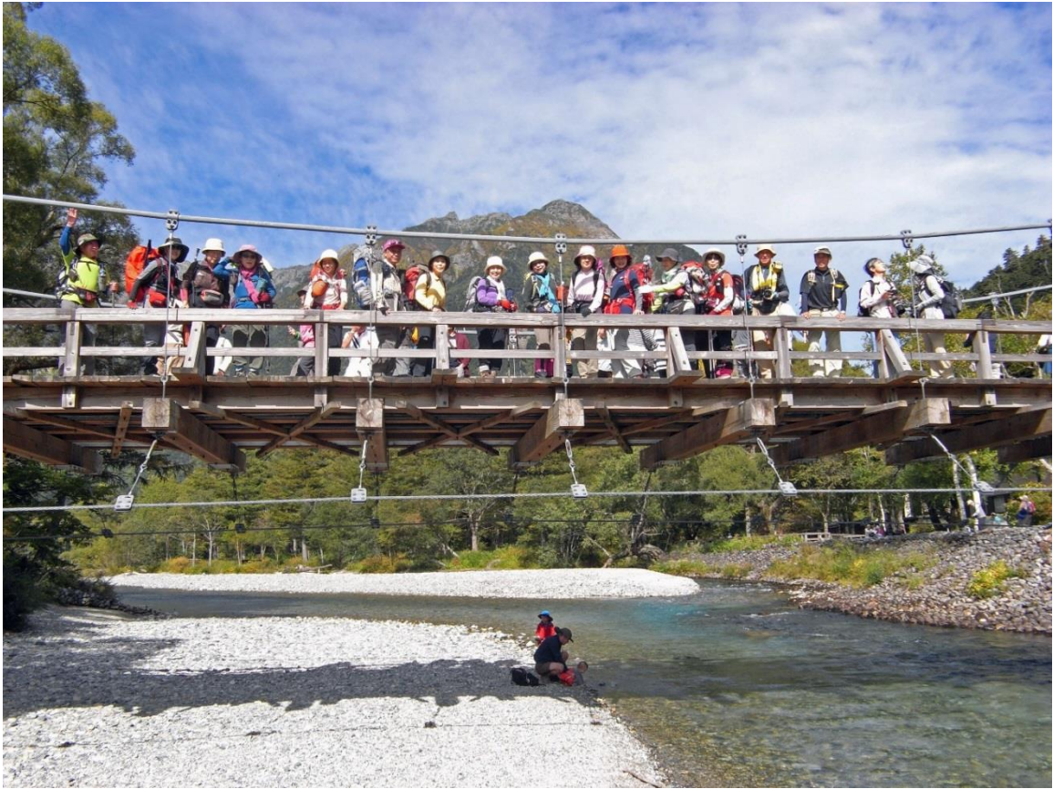
梓川に架かる有名な河童橋にて 背景は明神の山々