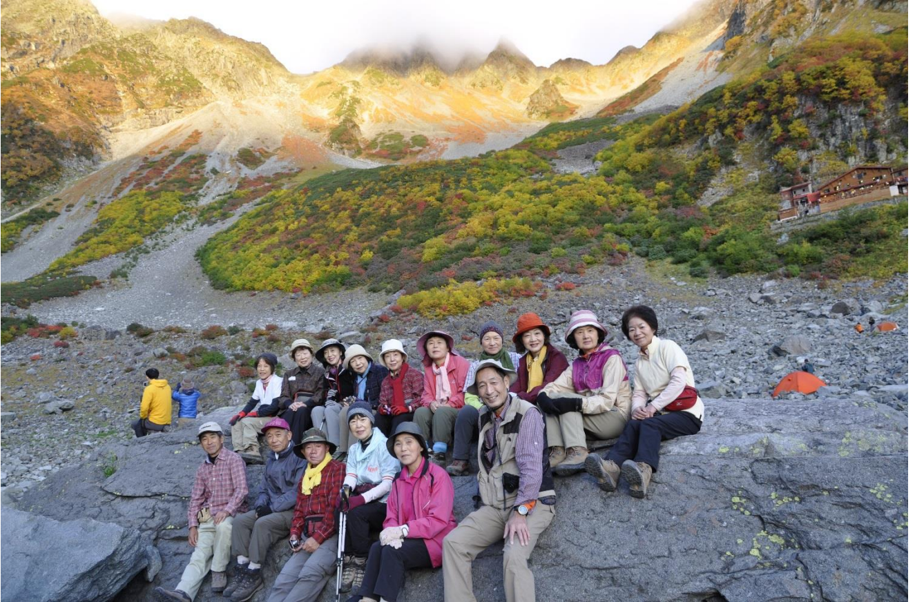
モルゲンロード朝焼けの始まり 昼寝岩にて