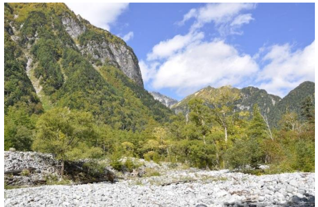
国内最大級の屏風岩