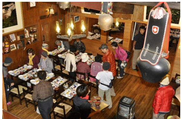
3 日：5 時の朝食