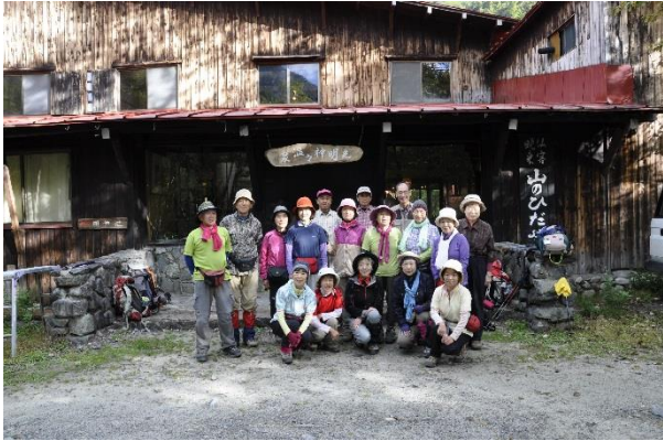
今日は涸沢カールへ。頑張るぞ！！