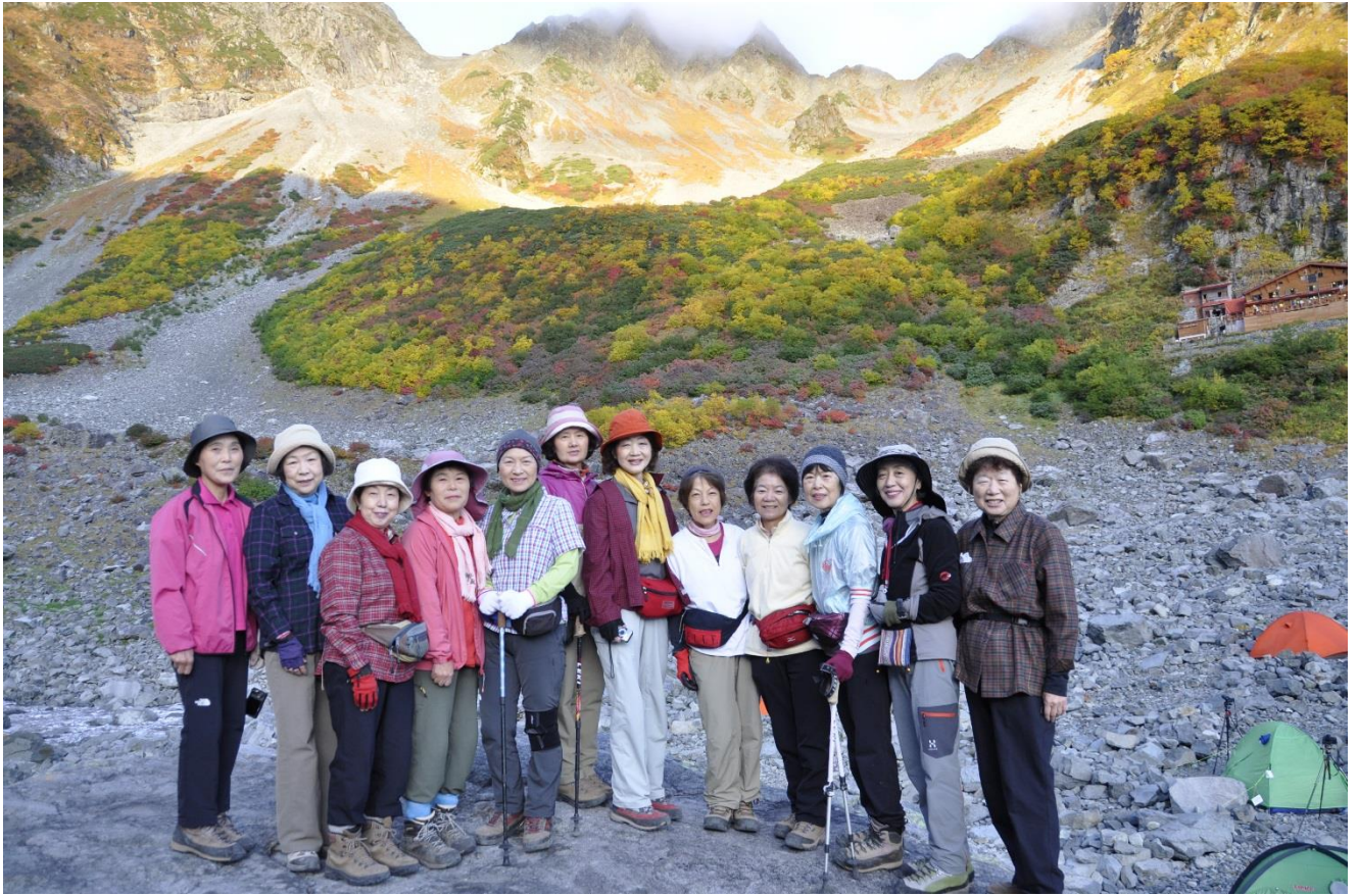
ご満悦のみなさん (^o^)/