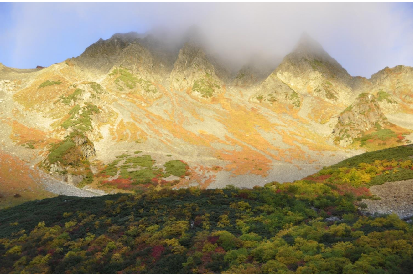
涸沢岳下の鮮やかな紅葉