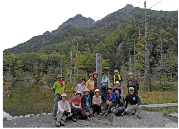
明神二之池 背景は明神岳