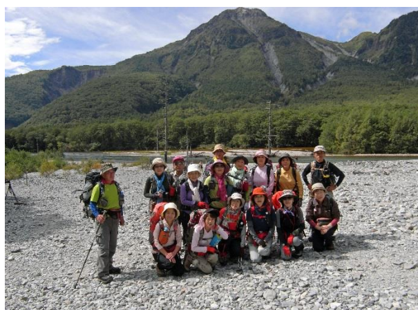
大正池 背景は焼岳