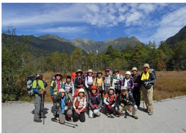
田代湿原 背景は穂高