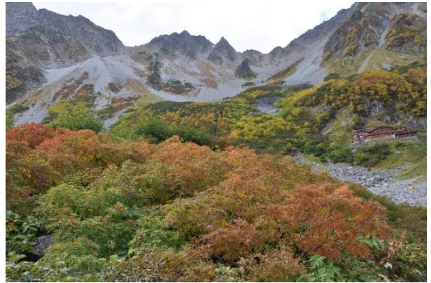
色づき始めたナナカマド越しに穂高