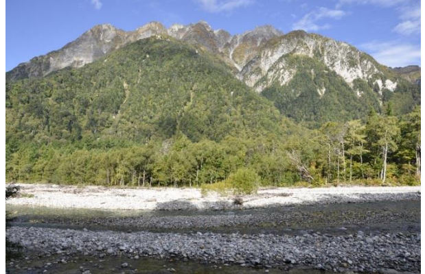
長七ノ頭、茶臼ノ頭、屏風ノ頭の峰嶺