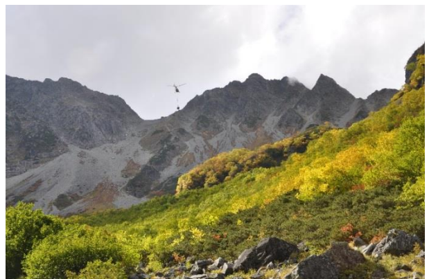
穂高が見えてきた