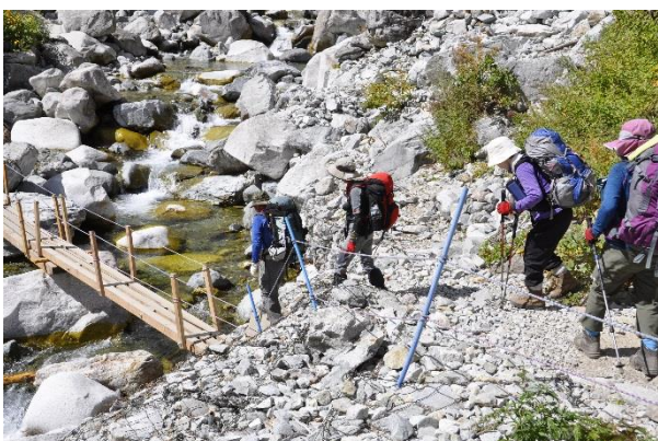
本谷橋で昼食タイム