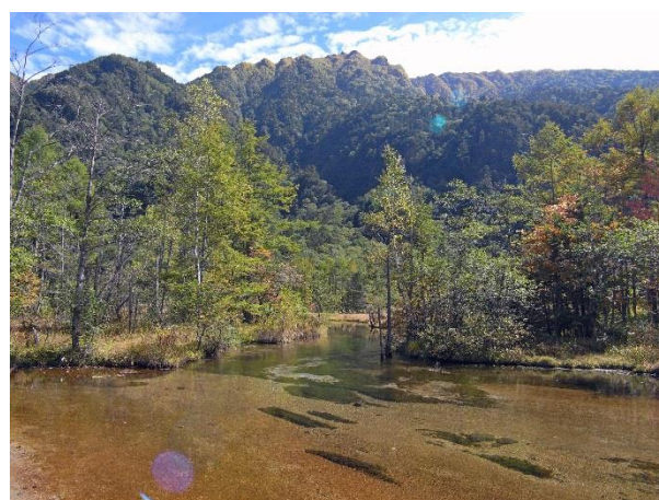
田代池 背景は霞沢岳の雄姿