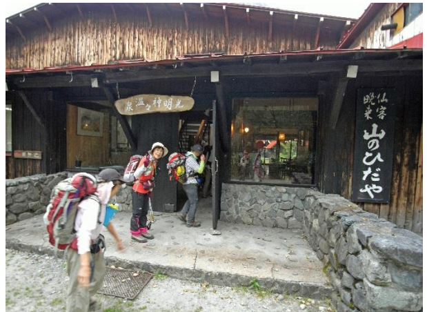
宿泊先「山のひだや」