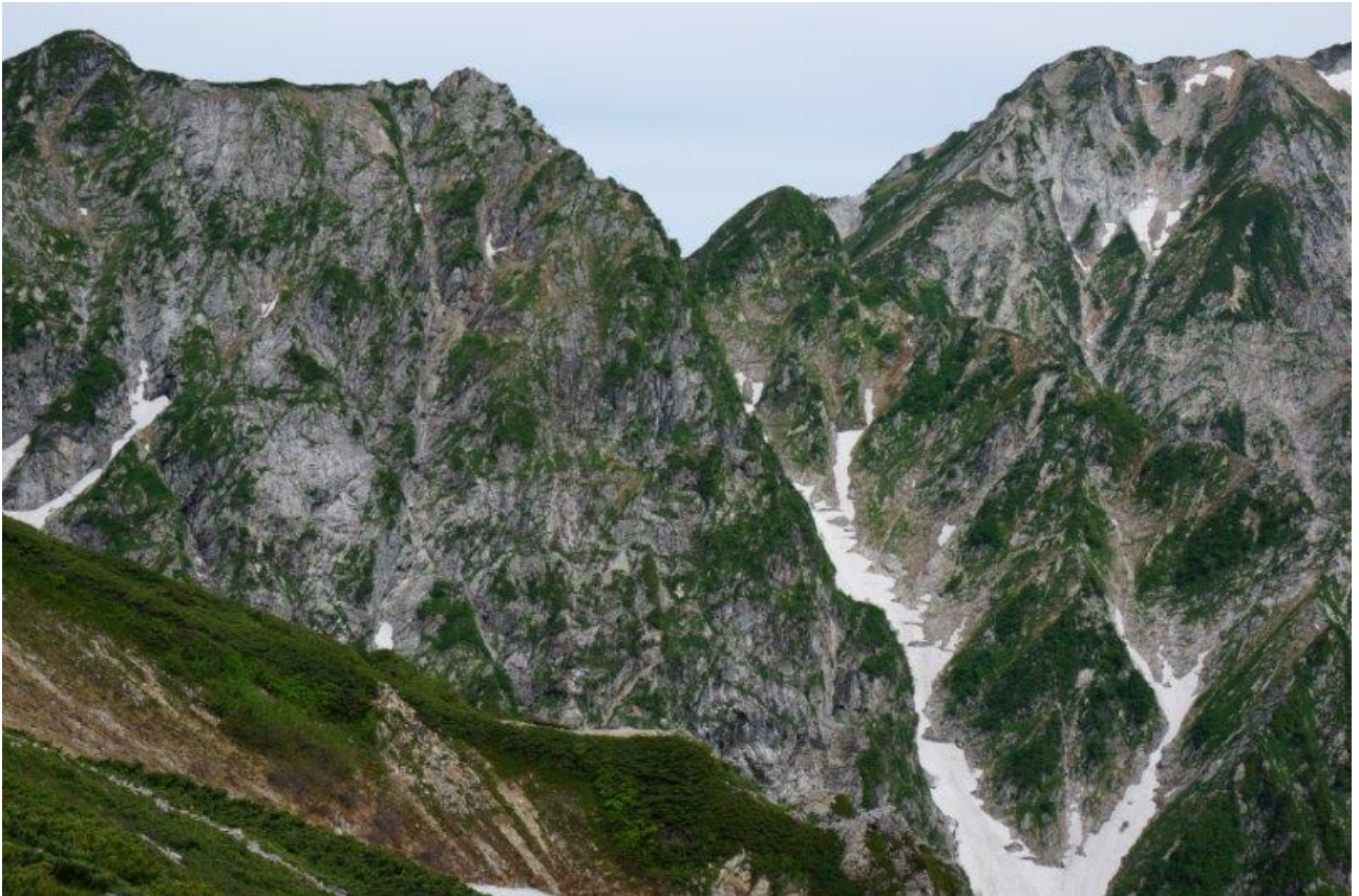
帰らずの剣の難所