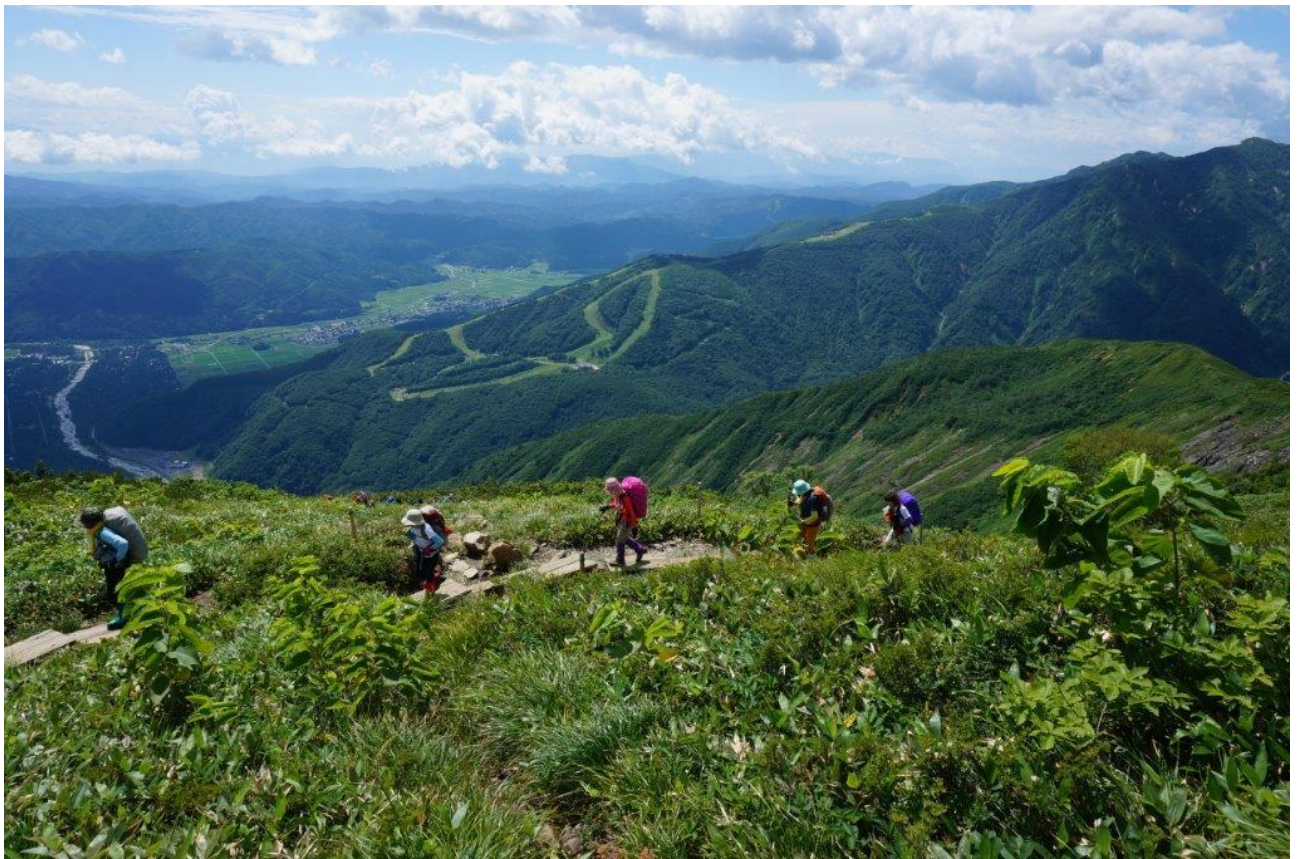
リフトを降りて登り開始