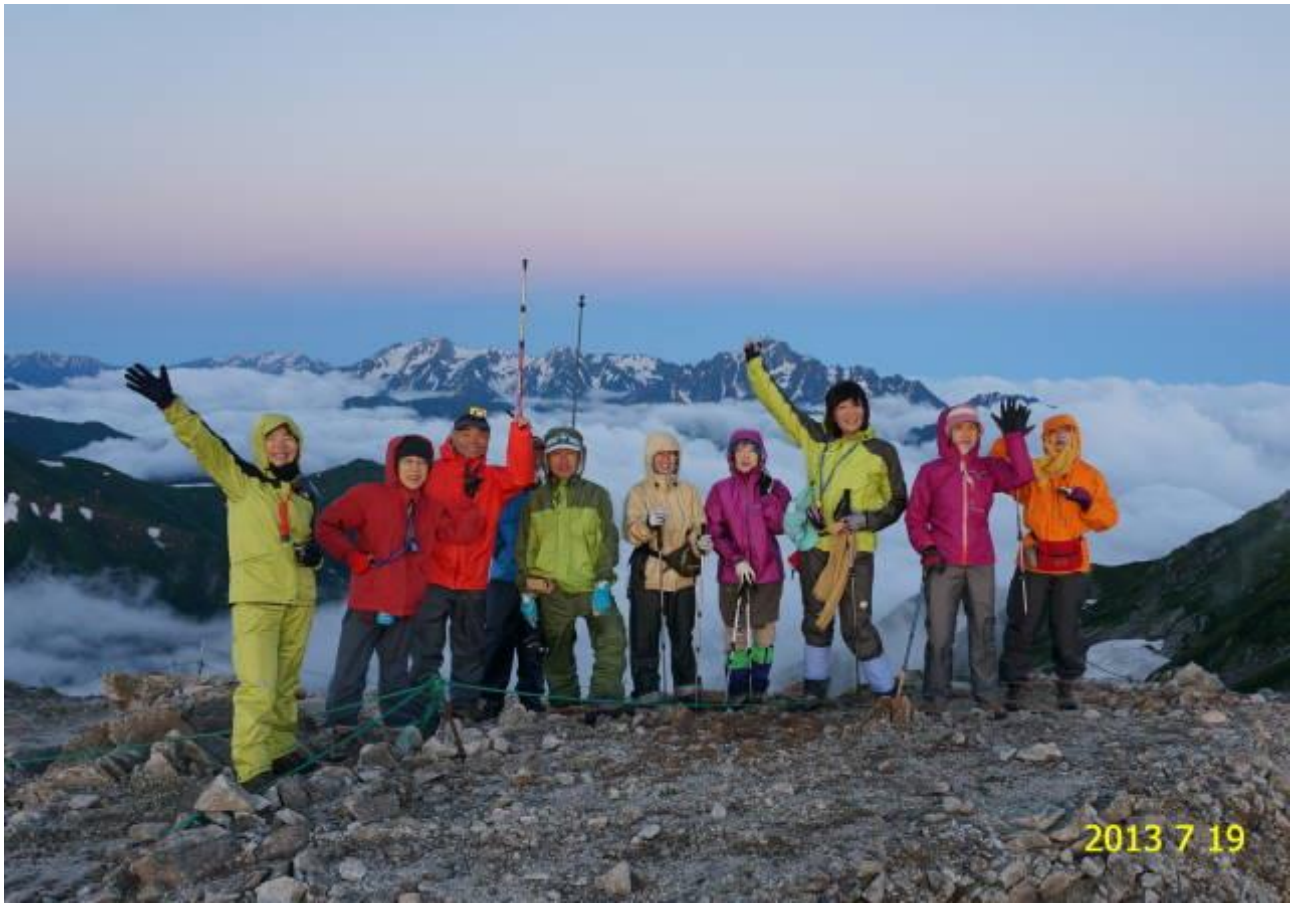
ご来光に感激、バックは立山連峰