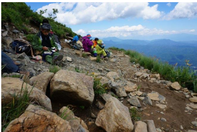
眺望をツマミに昼飯