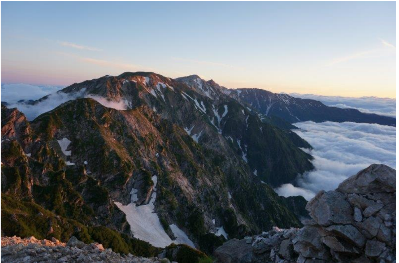
朝日に輝く白馬三山