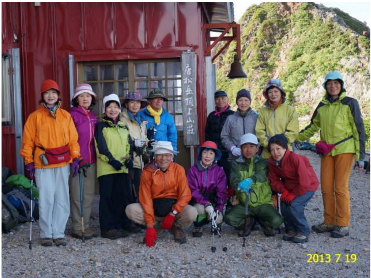
唐松岳頂上山荘前