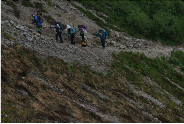
コース最大の急登