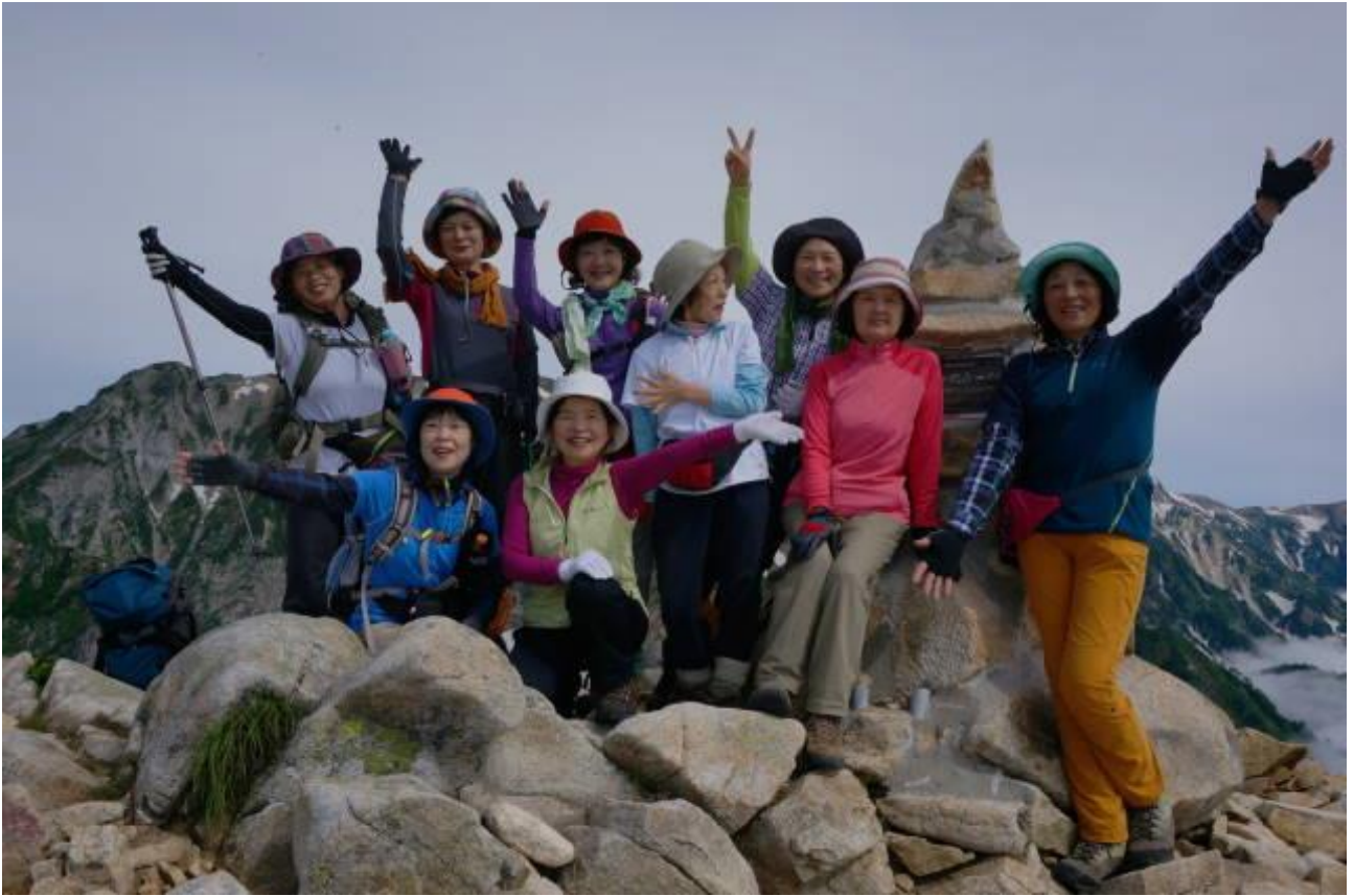
丸山ケルン、ムードメーカーの面々