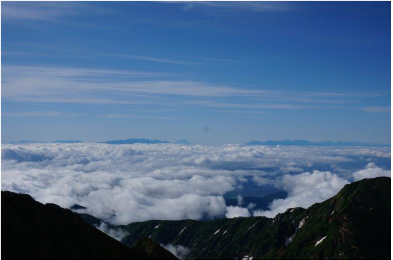
南アルプスと富士山