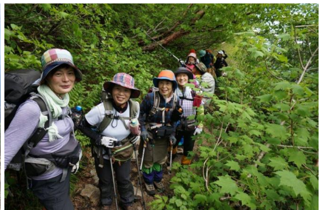
頭を気になるダテカンバ林