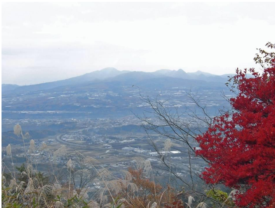
神社境内から朱色が鮮やかなドウダンツツジ越しに赤城連山を望む