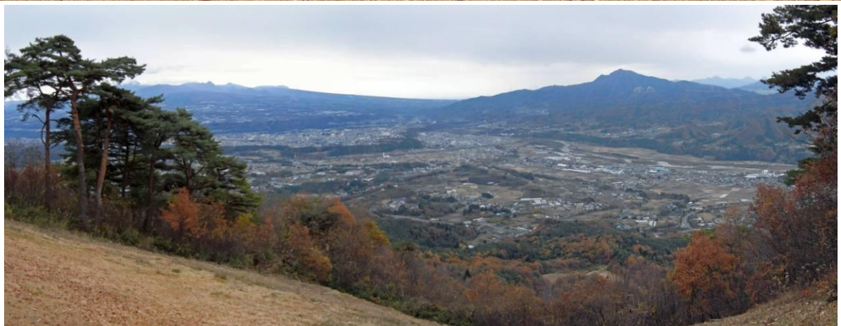
テイクオフ場から 右：子持山 左：赤城山連峰 下方：沼田市街