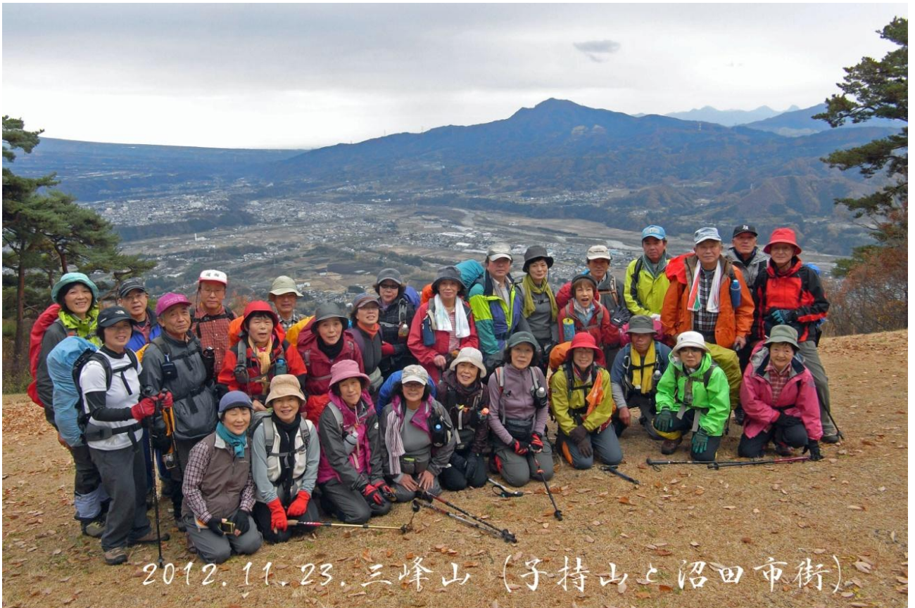
2012.11.23. 三峰山 (子持山と沼田市街)