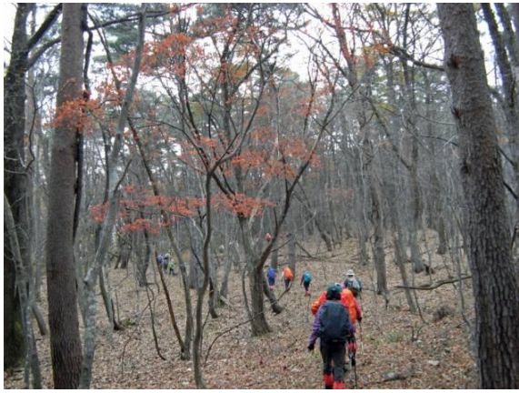
落葉を踏みしめて林道を歩く