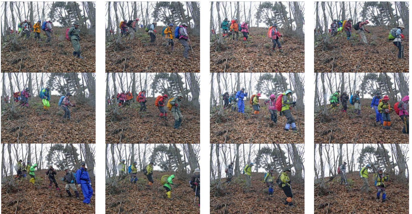
山頂直下から下り開始