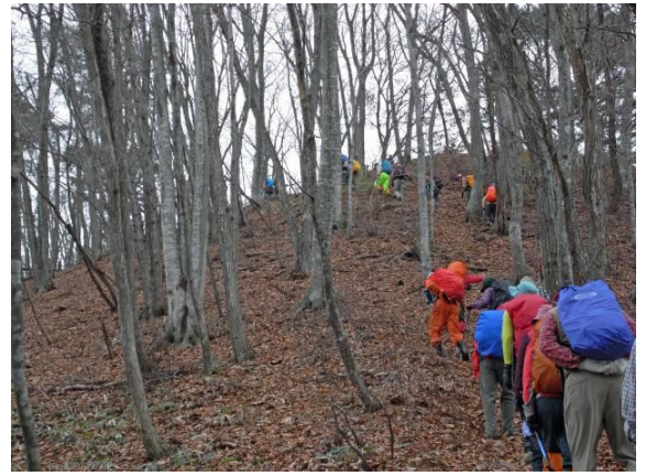
何度も起伏を越え、もうすぐ山頂