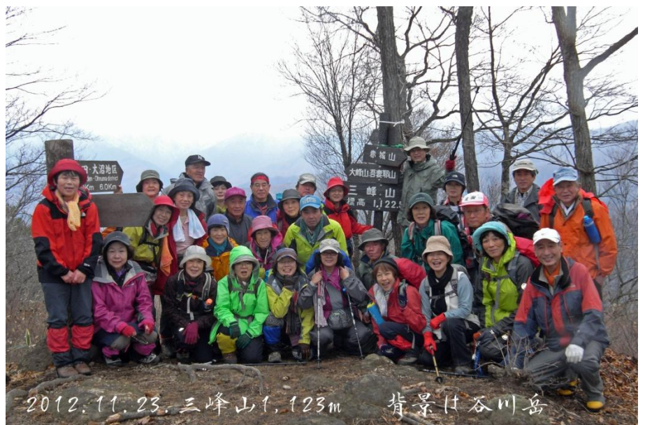
2012.11.23. 三峰山(1,123m) 背景は谷川岳