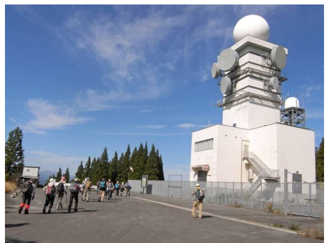
雨雪量計レーダー基地に到着