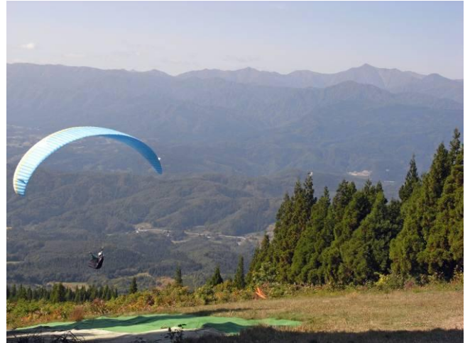
パラグライダーと朝日連峰