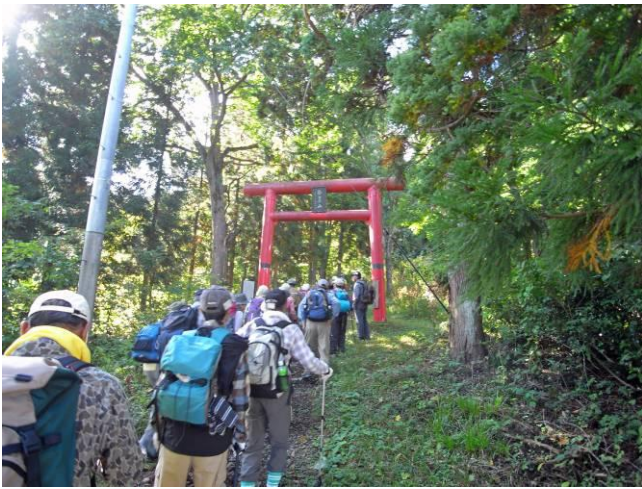
嶽原登山口の鳥居