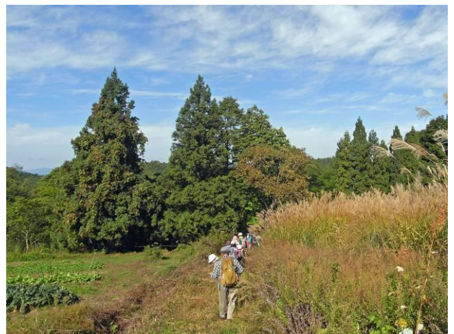
ススキの原の放牧場、大平登山口へ