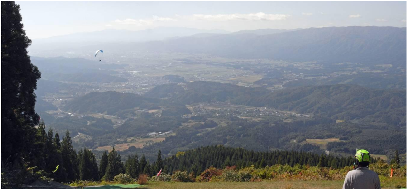
遠くに飯豊連峰とトンビのように舞うパラグライダー