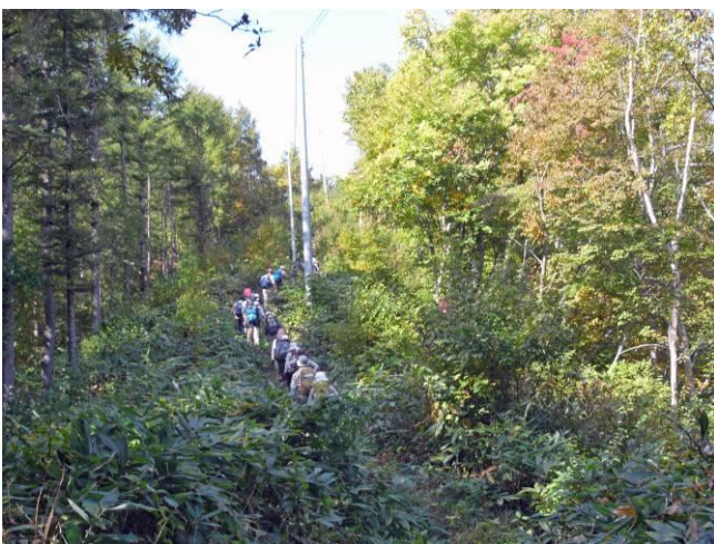
白鷹山レーダー地に向かう