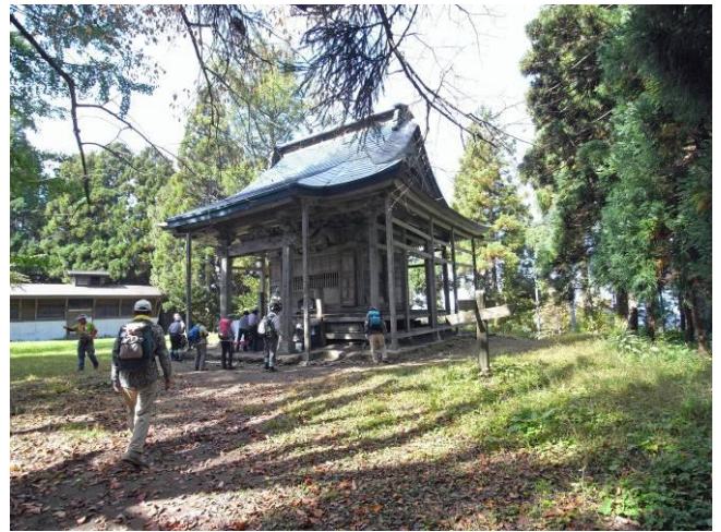
山頂 994m の虚空蔵神社