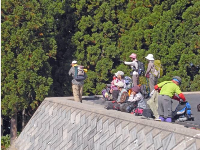
日射しを浴びながらこれから昼食