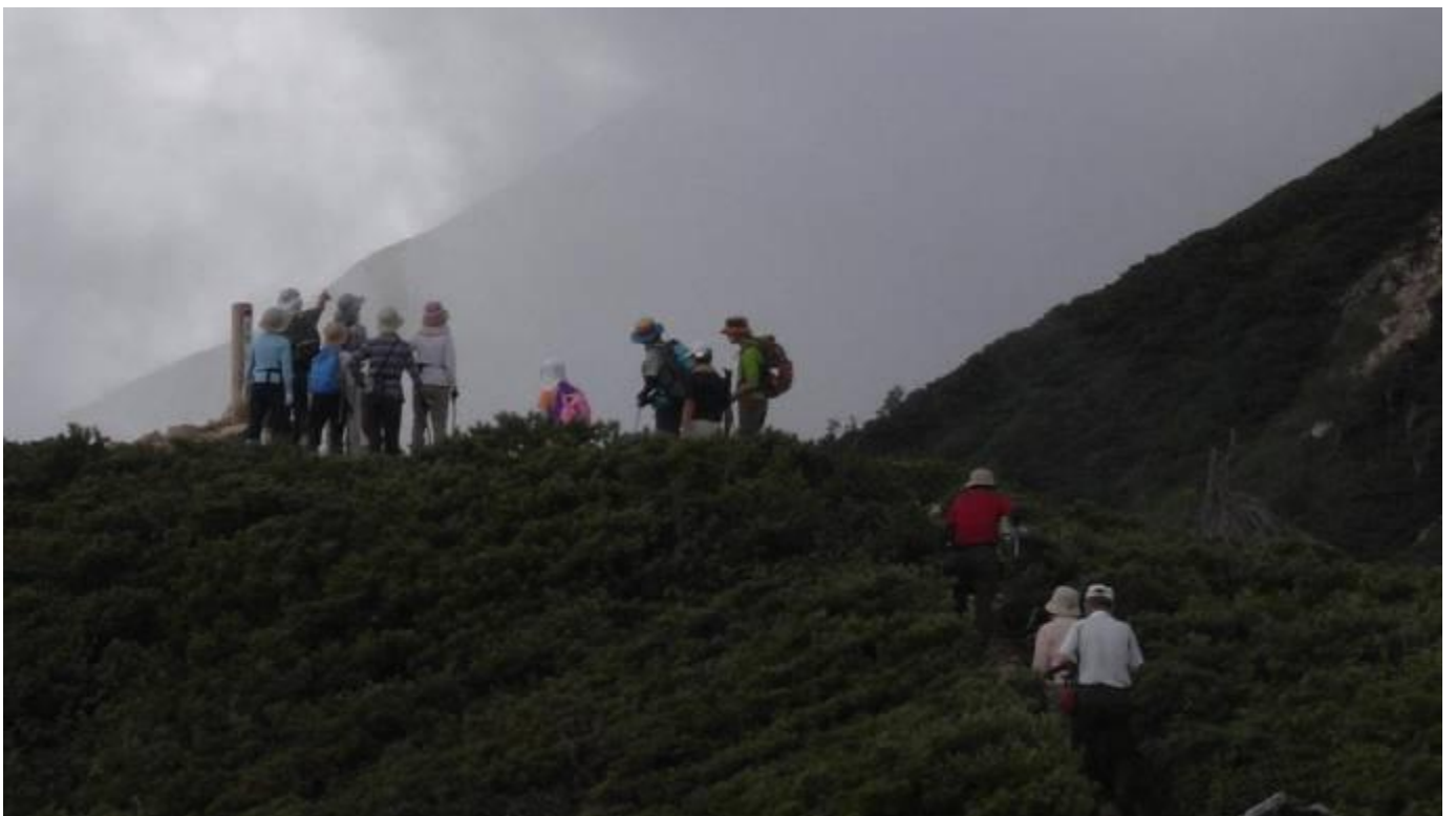
西穂・丸山山頂 2,452m で、リーダーの説明が聞こえるようだ。