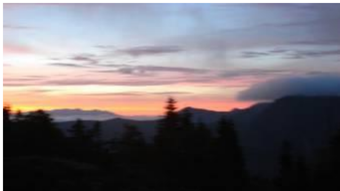
西穂山荘からの夜明け