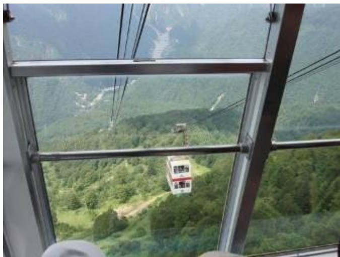
新穂高ロープウェイ