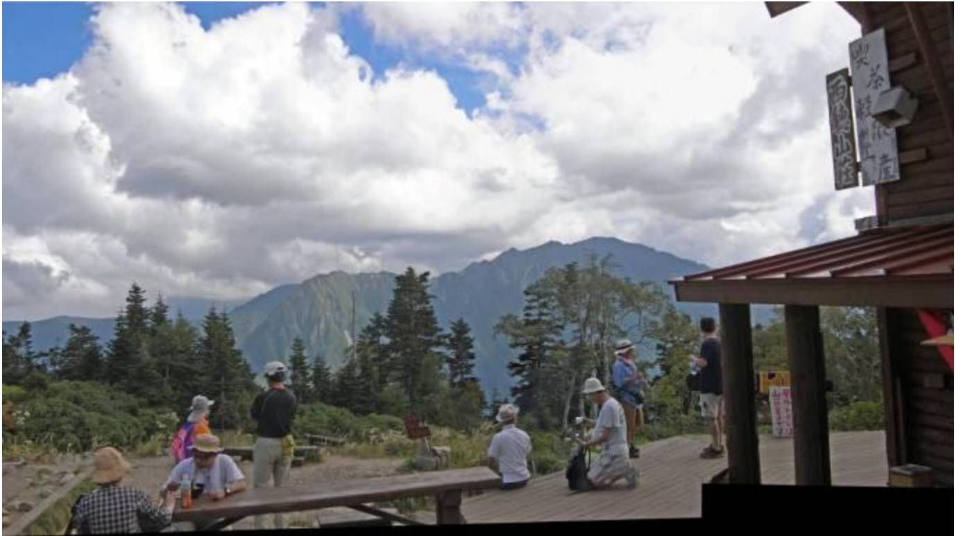
西穂山荘広場から見た左から六百山、霞沢岳 2,646m