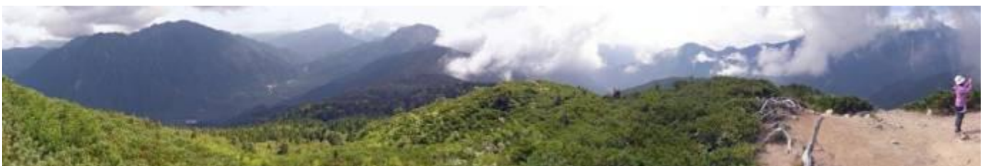
左から六百山、霞沢岳 2,646 m、大正池、乗鞍岳、焼岳が見える。右は錫杖岳、笠ヶ岳か？