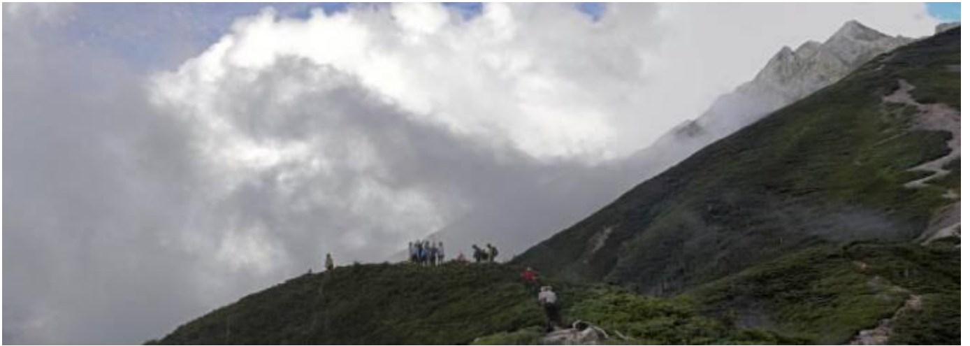
西穂・丸山山頂 2,452m からの穂高の峰