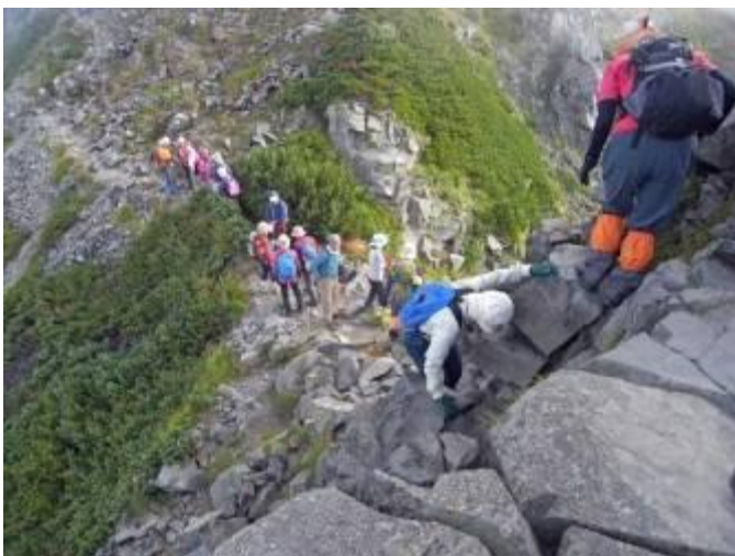
上り下りの渋滞岩場