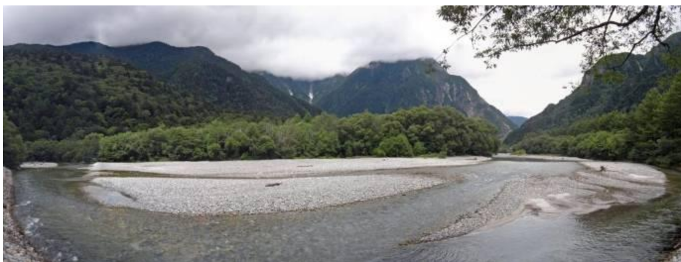
上高地の梓川沿いから穂高を望むが残念ながら見えず