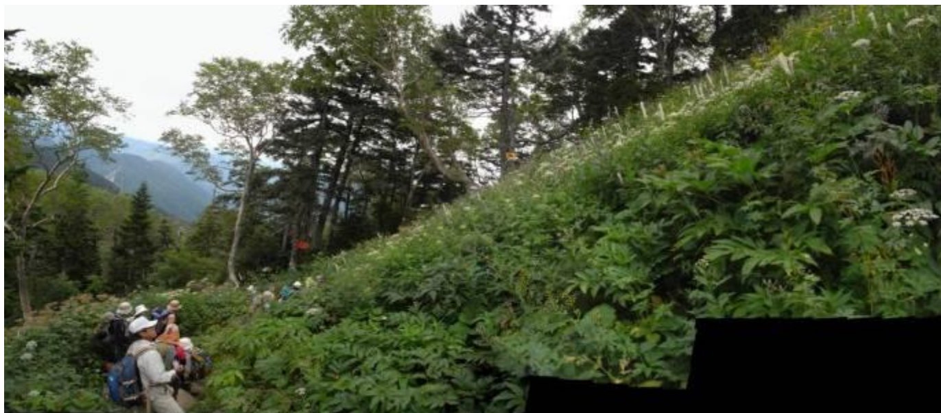
西穂山荘直下の花畑