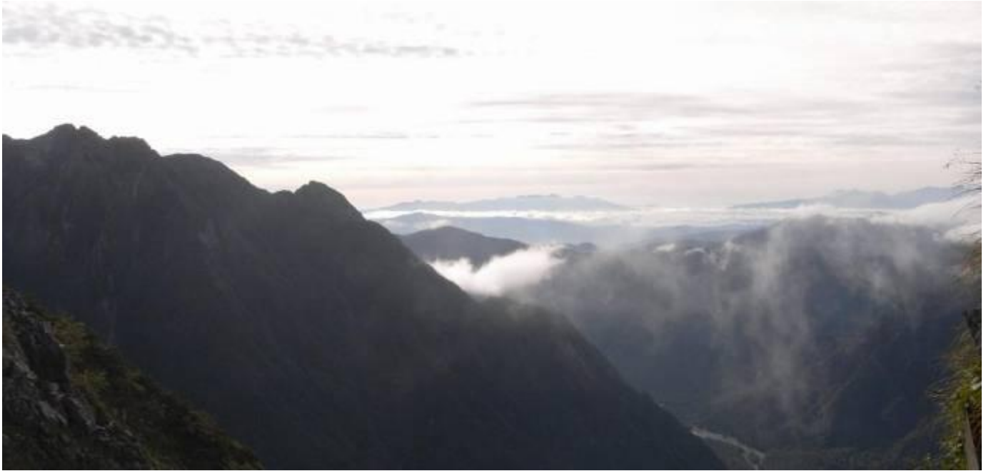
遠くに左からハヶ岳連峰、右に富士山が見えた