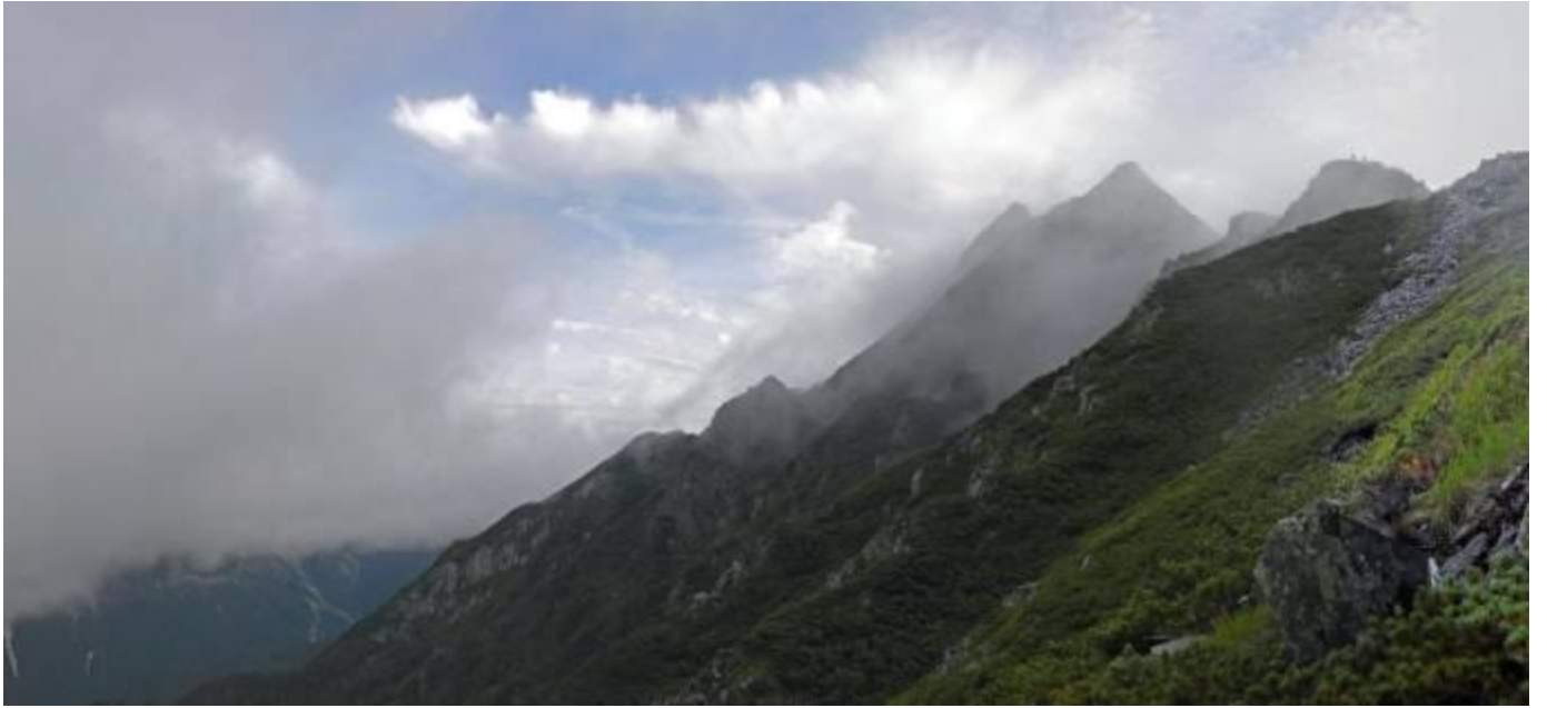
昨日と違う凜とした光景