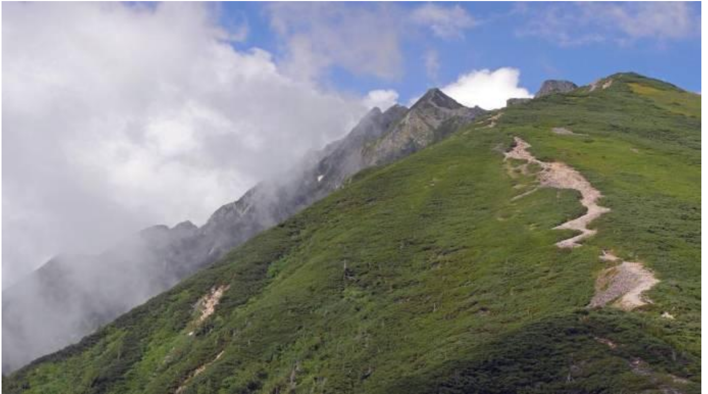
明日登る急こう配の稜線と穂高の峰々