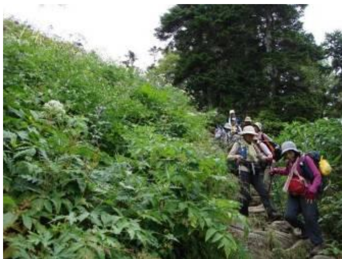
下りは気を付けて