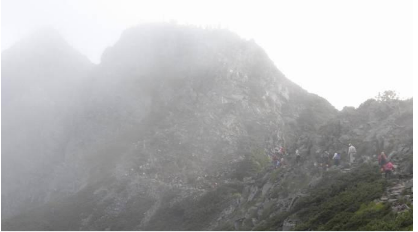
朝霧の掛る独標を目指すメンバー