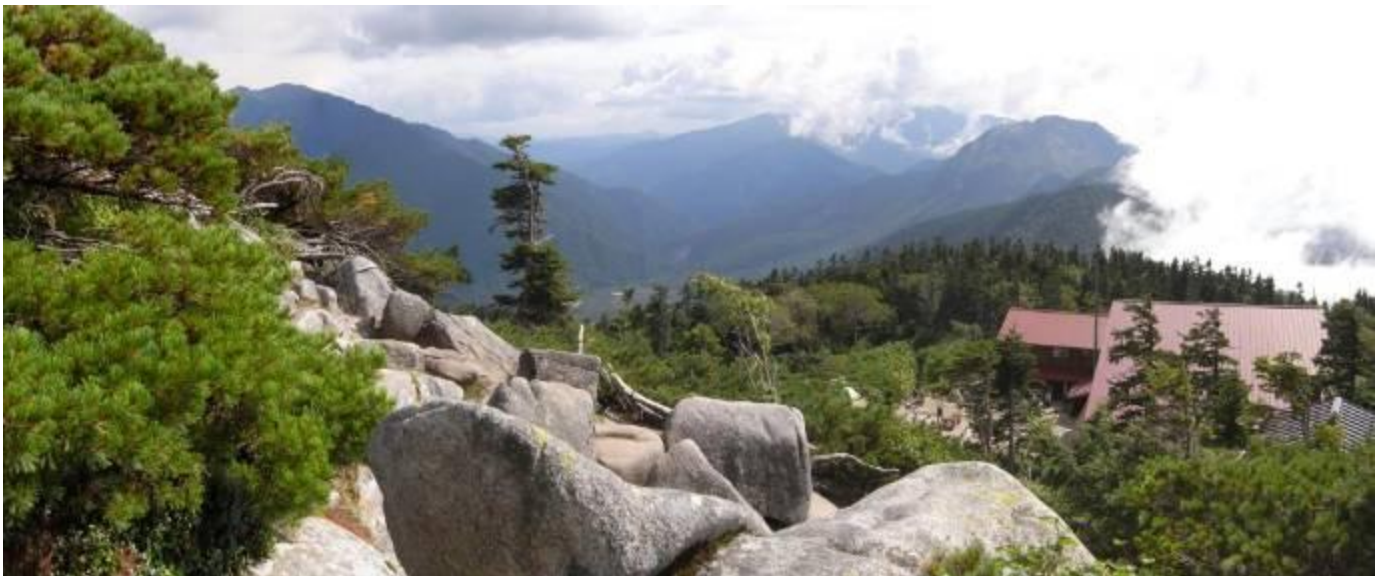
西穂山荘、焼岳 2,455m と最奥に乗鞍岳 3,026m