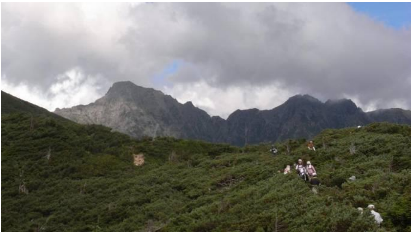
西穂高、奥穂高、前穂高の峰々だ！！