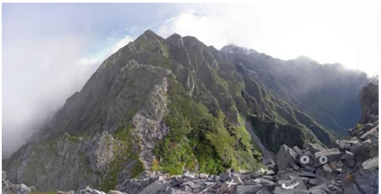
西穂独標山頂からの山群 左からピラミットピーク、西穂高岳、西穂 P1、 間ノ岳、ジャンダルム、奥穂高岳、吊り尾根、前穂高岳、明神岳