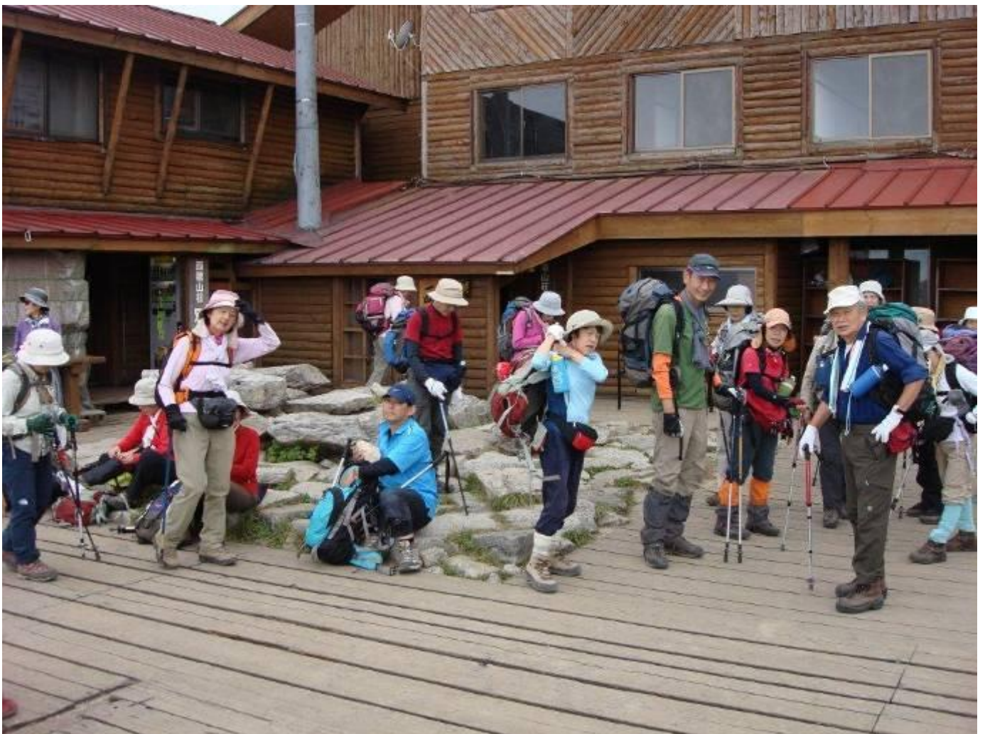
これから上高地へ下る西穂山荘前のひとコマ