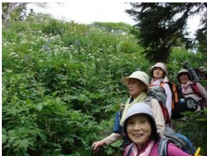
お花畑でニッコリと