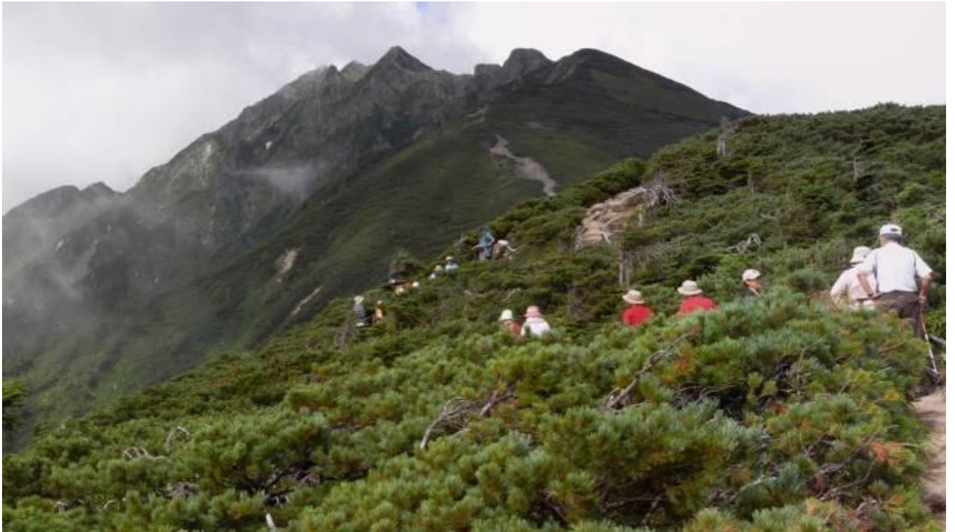
西穂・丸山に向かう。前方は穂高岩稜連峰群