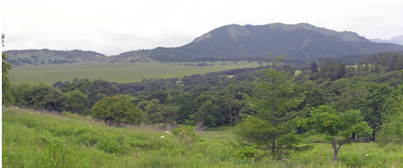
八島ヶ原湿原全景