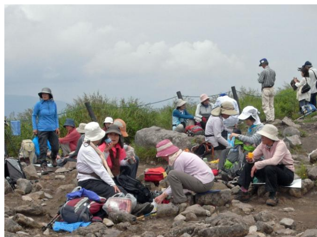
山頂での楽しいひととき