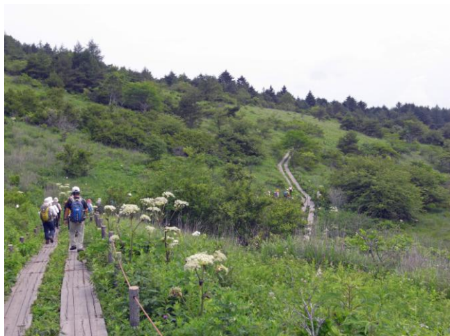
八島ヶ原湿原の木道を行く