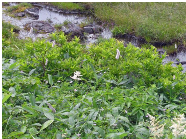
池塘に咲く植物群