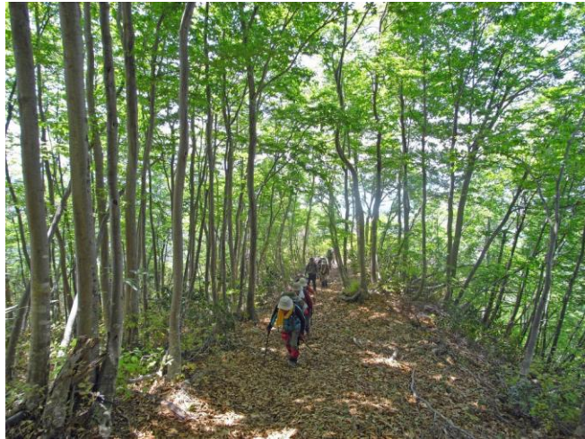
日陰が有難いブナ林の中を登る