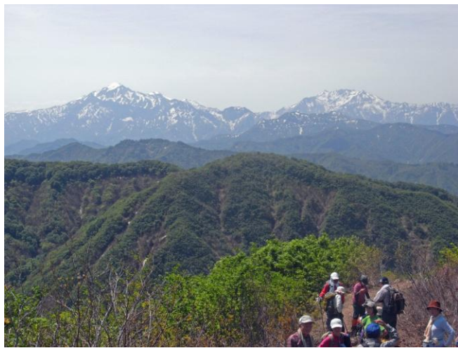
越後三山を望みながらの休憩