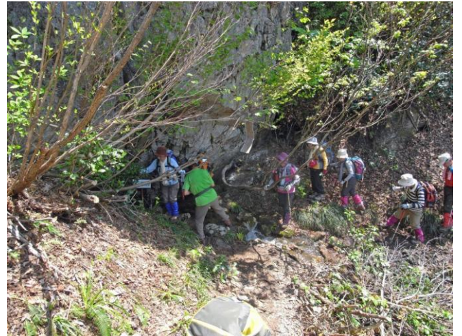
冷たい湧水の弥三郎清水で喉を潤す