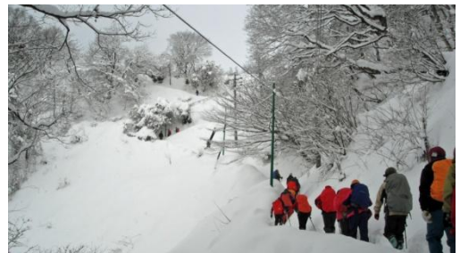
雪景色の8合目付近