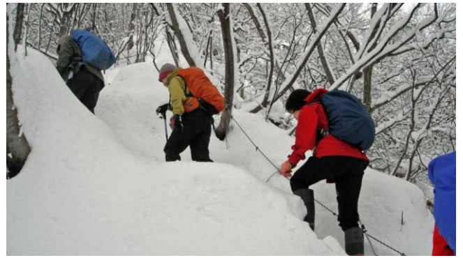
雪の尾根道を登る