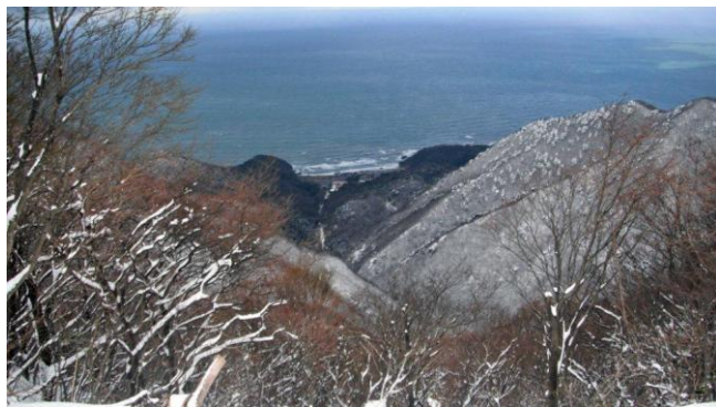
9合目からの日本海