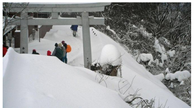
山頂札所前で小休止