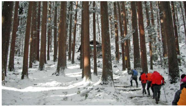
清水小屋付近の杉木立