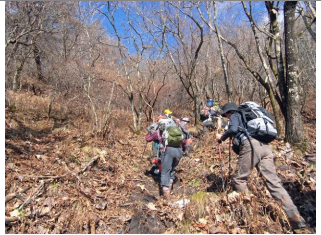
林道分岐先ここからが登り