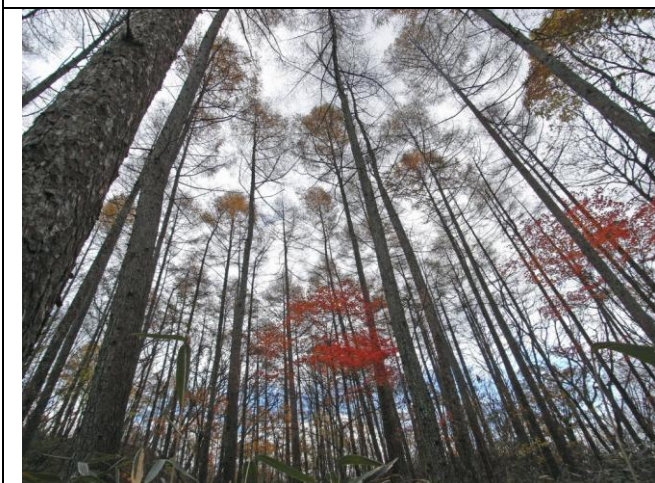
凜としたカラマツと紅葉