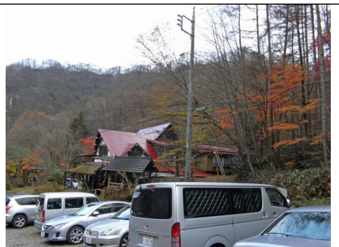
霧積温泉登山口 霧積館