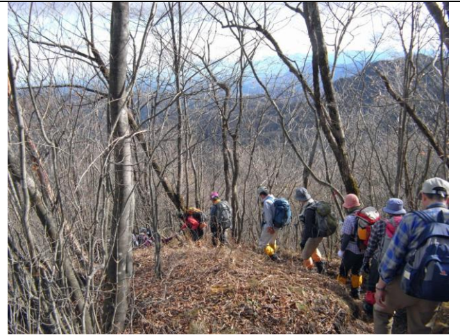
山頂からの霧積へ下山開始