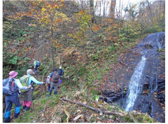
ベテランコースに入り、分岐付近の滑滝を渡る