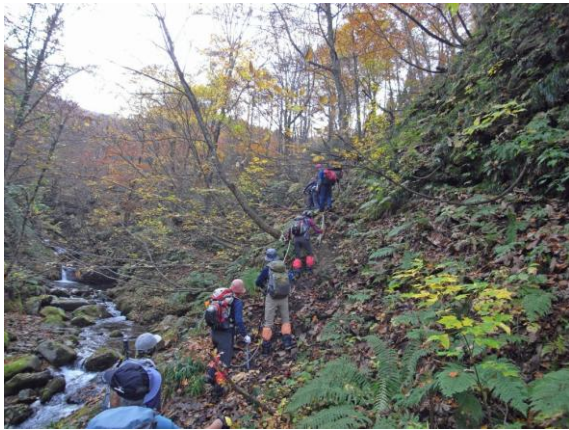
溪谷を見ながらの登り