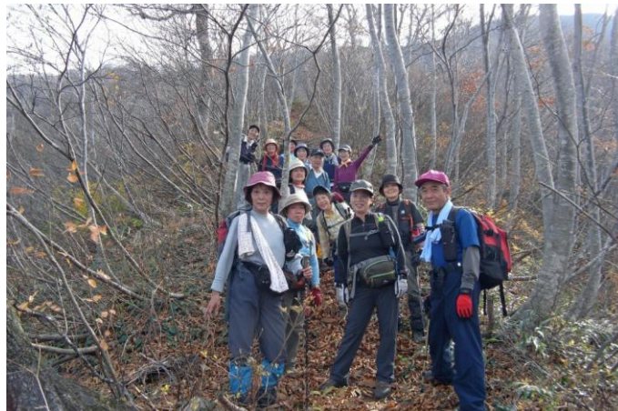
急登の連続が終わり ハイポーズ