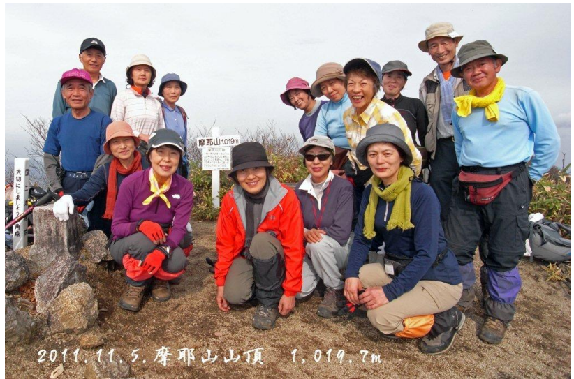
摩耶山山頂 1,019.7m 一等三角点