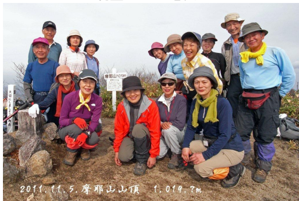
山頂 1,019.7m 一等三角点で