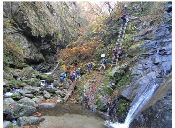
弁財天滝のハシゴを登る