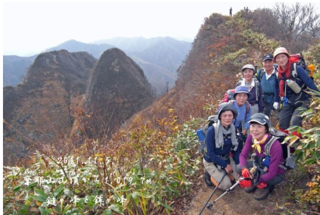
眺望のよい尾根で