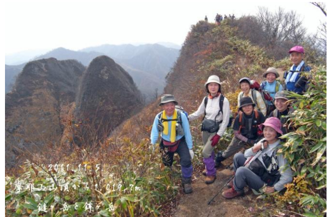
眺望のよい尾根で