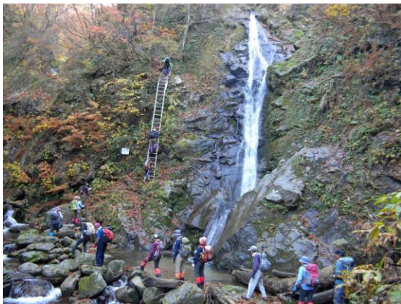
弁財天滝脇を渡渉