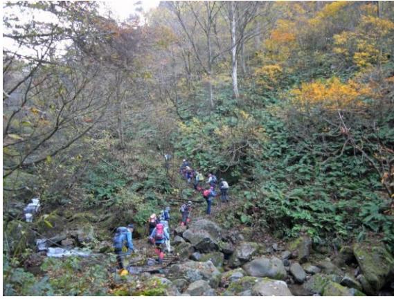
カシノ倉下の橋を渡る