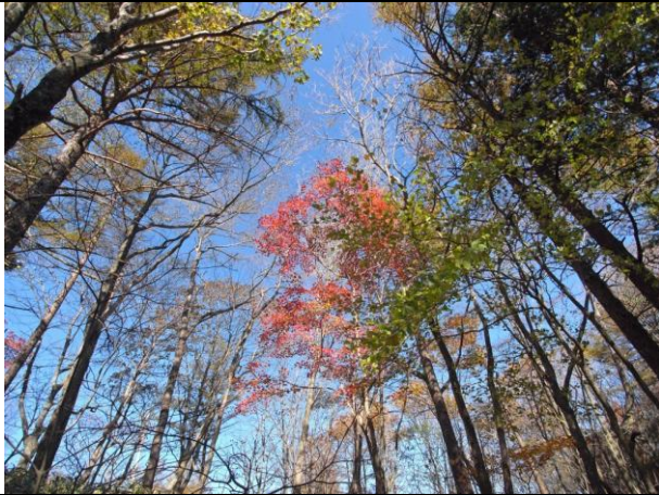
青空に映える紅葉