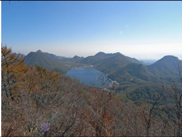
尾根からの外輪山 1