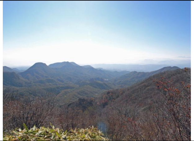
尾根からの外輪山 2