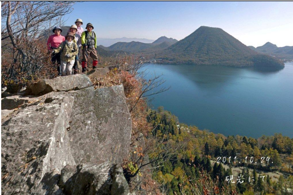
硯岩からの榛名富士、榛名湖を望む