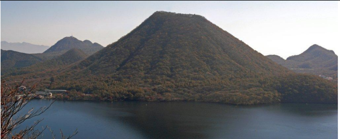
硯岩からの榛名富士と外輪山