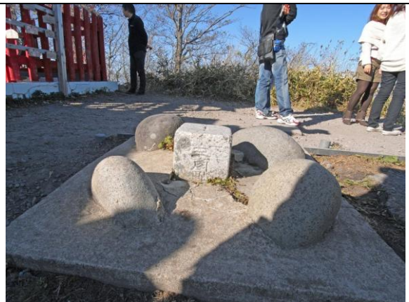
榛名富士山頂 一等三角点