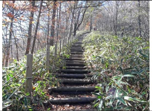
ほぼ 500 段の階段