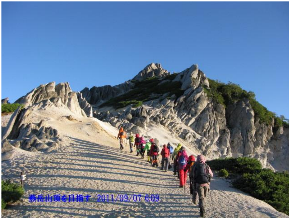
燕岳山頂に向かう