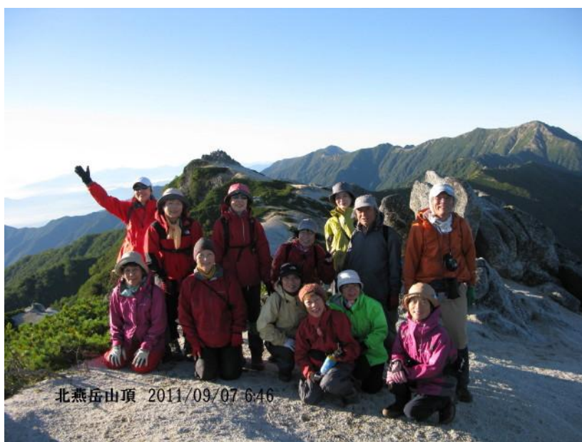
北燕岳山頂までもう一歩