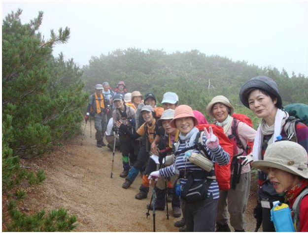
元気に登山、八合目