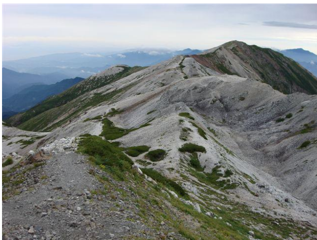
白馬岳より小蓮華山