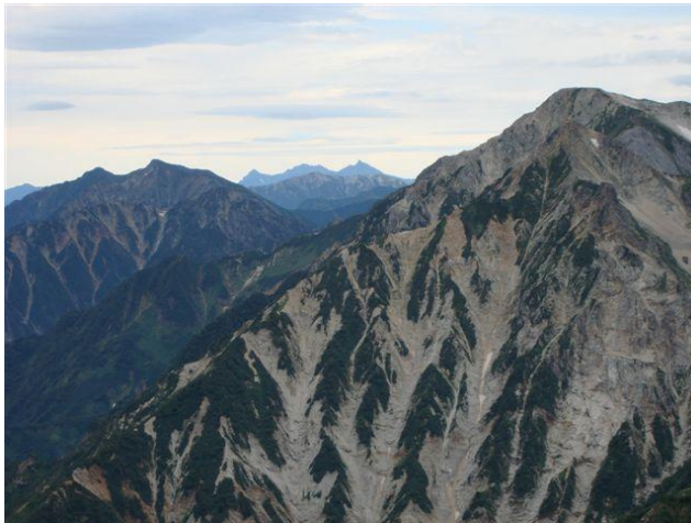
手前は白馬鑓、奥は唐松岳