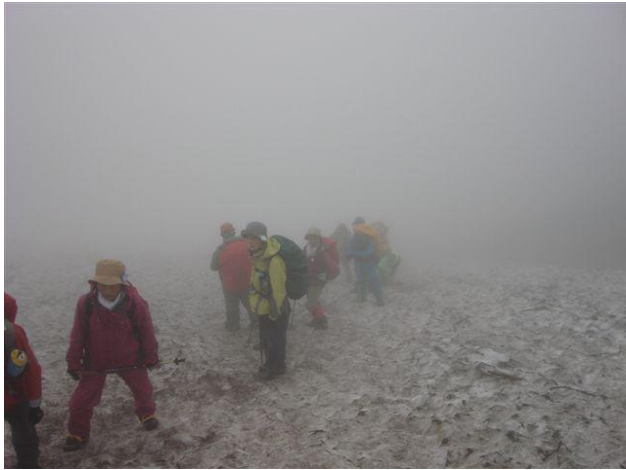
霧の大雪山を登る