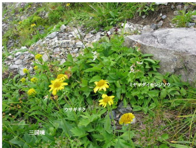
ウサギギク、ミヤマダイヤモンドソウ