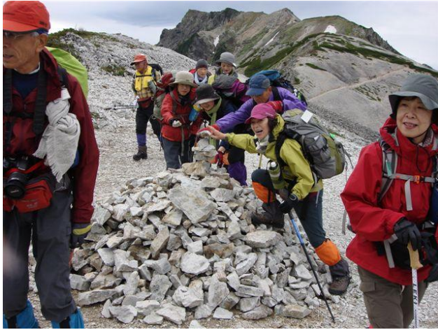
ケルン積み安全祈願