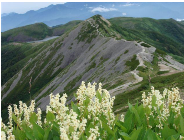
尾根歩きも後わずか