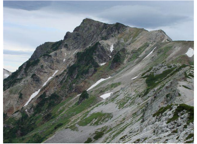
三国境より白馬岳