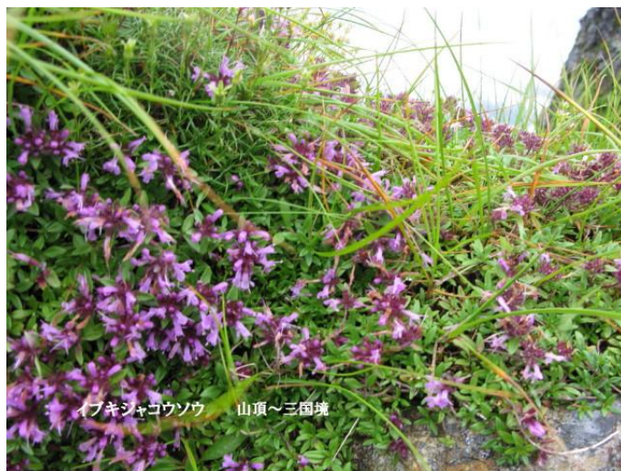
イブキシヤコウソウ