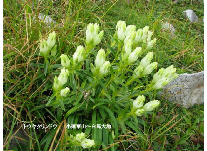
トウヤクリンドウ