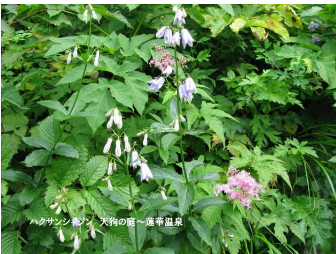
ハクサンシャジン