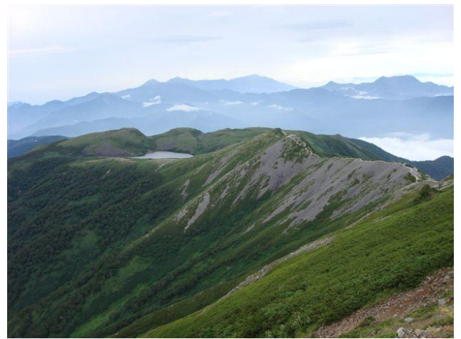
小蓮華から白馬大池