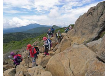
森林限界を抜け小至仏山へ