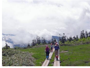
原見岩付近の湿原