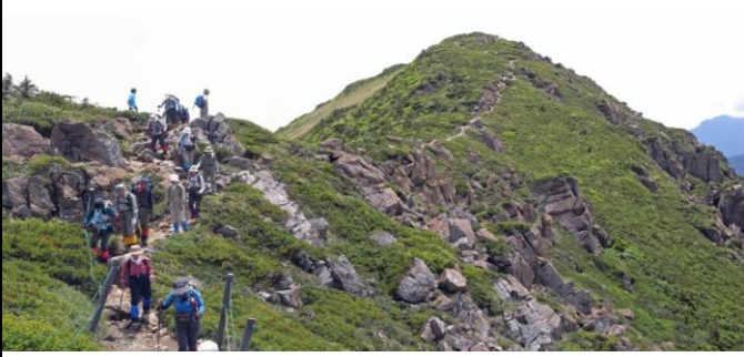
小至仏山を過ぎて