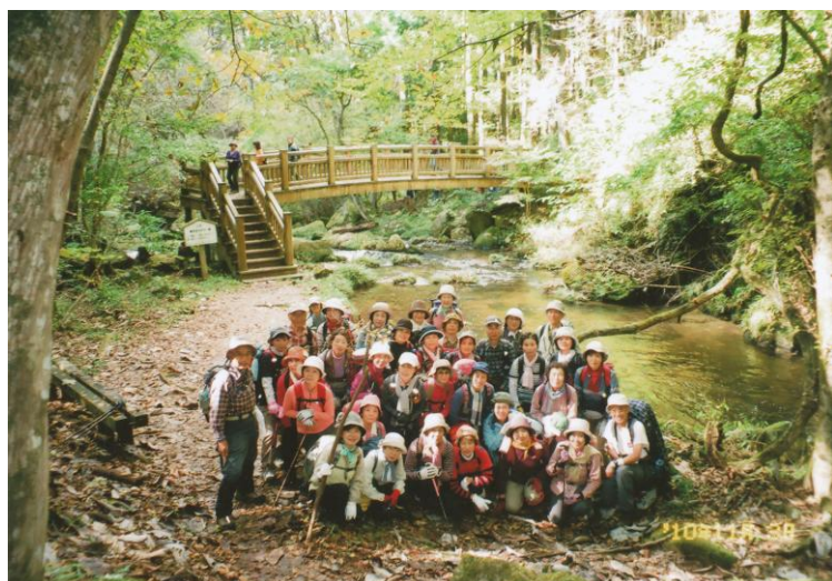
「滝川渓谷」七丁目付近の橋を背に