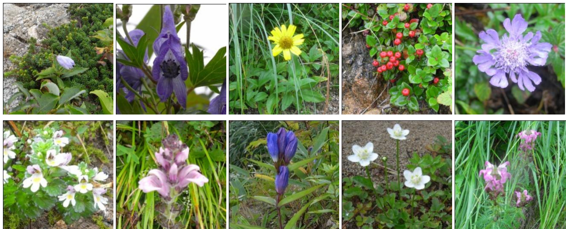
出会えた高山植物