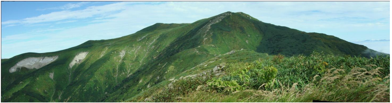
草履塚からの飯豊の山並み