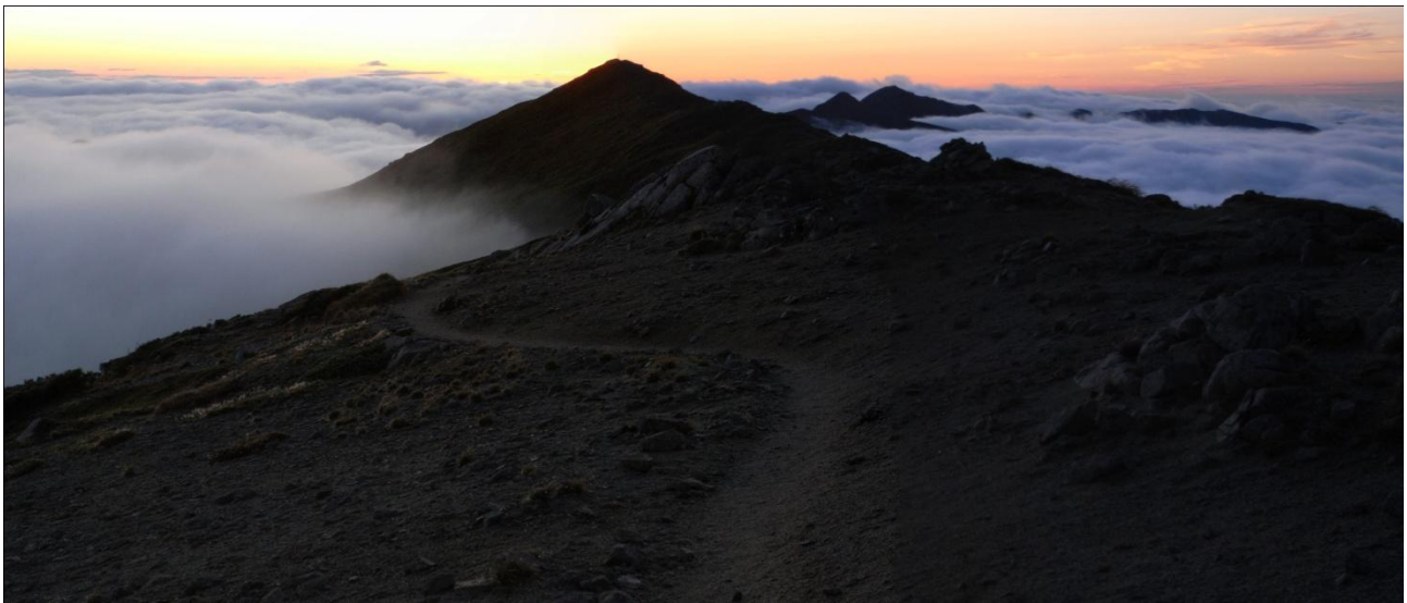
本山小屋から夕照の飯豊連峰