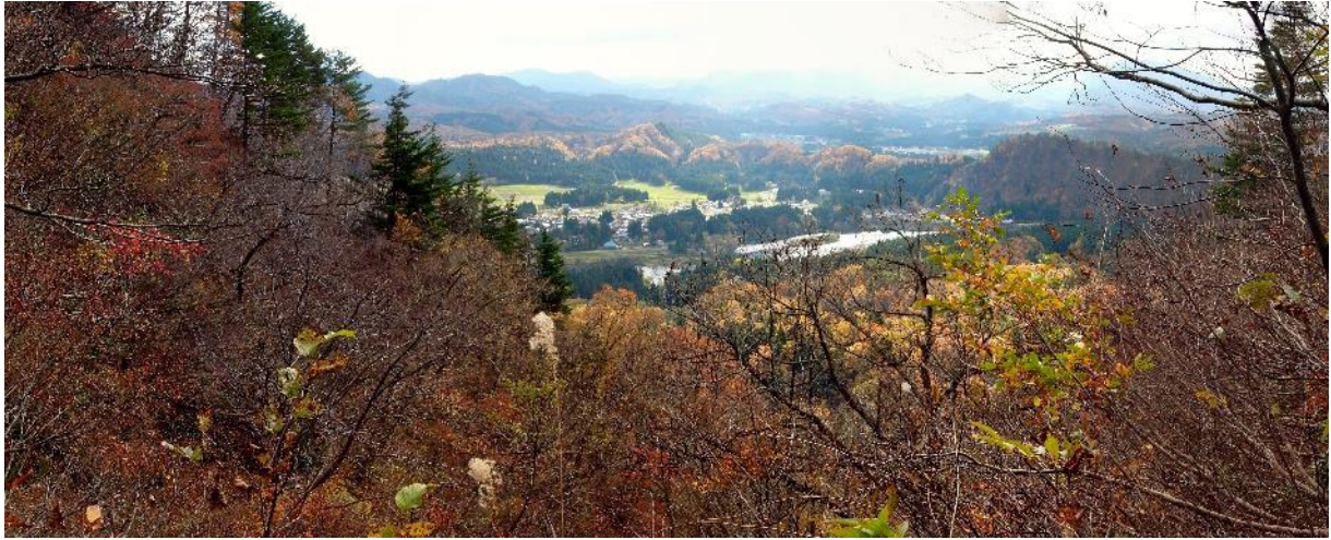
初冬の色に染まる山、麒麟山温泉街、阿賀野川、麒麟山