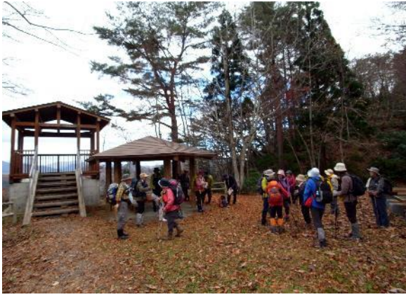
天女の花筏展望所