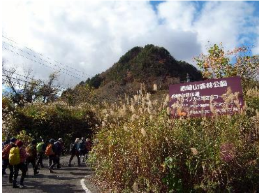
赤崎山のサイノカミ峠登山口へ