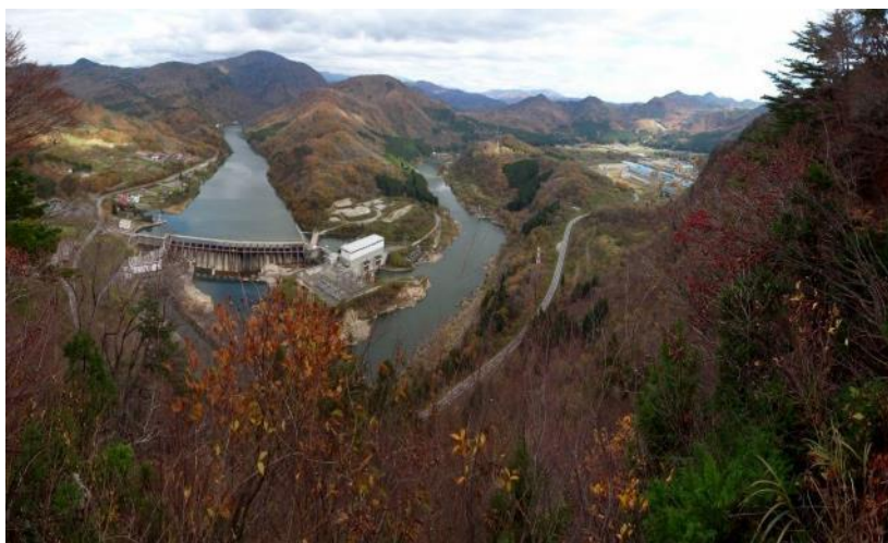
蛇行した阿賀野川と鹿瀬発電所