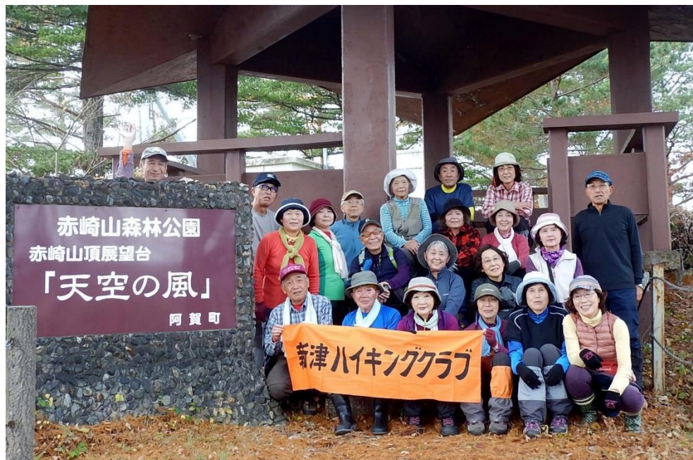
赤崎山山頂 371.9m にて