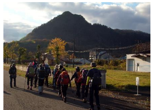
赤崎山を見ながら鹿瀬駅へ