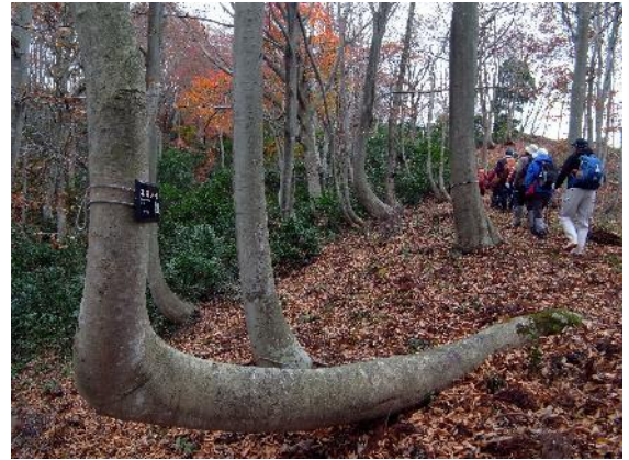
根曲りしたたくましいホオノキ