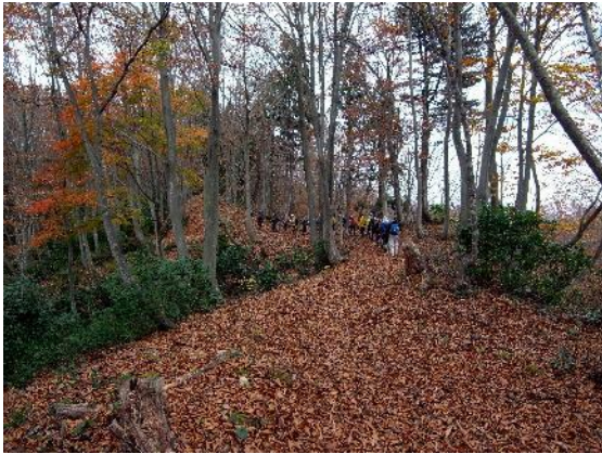
さくさくの落葉を踏みしめて歩く