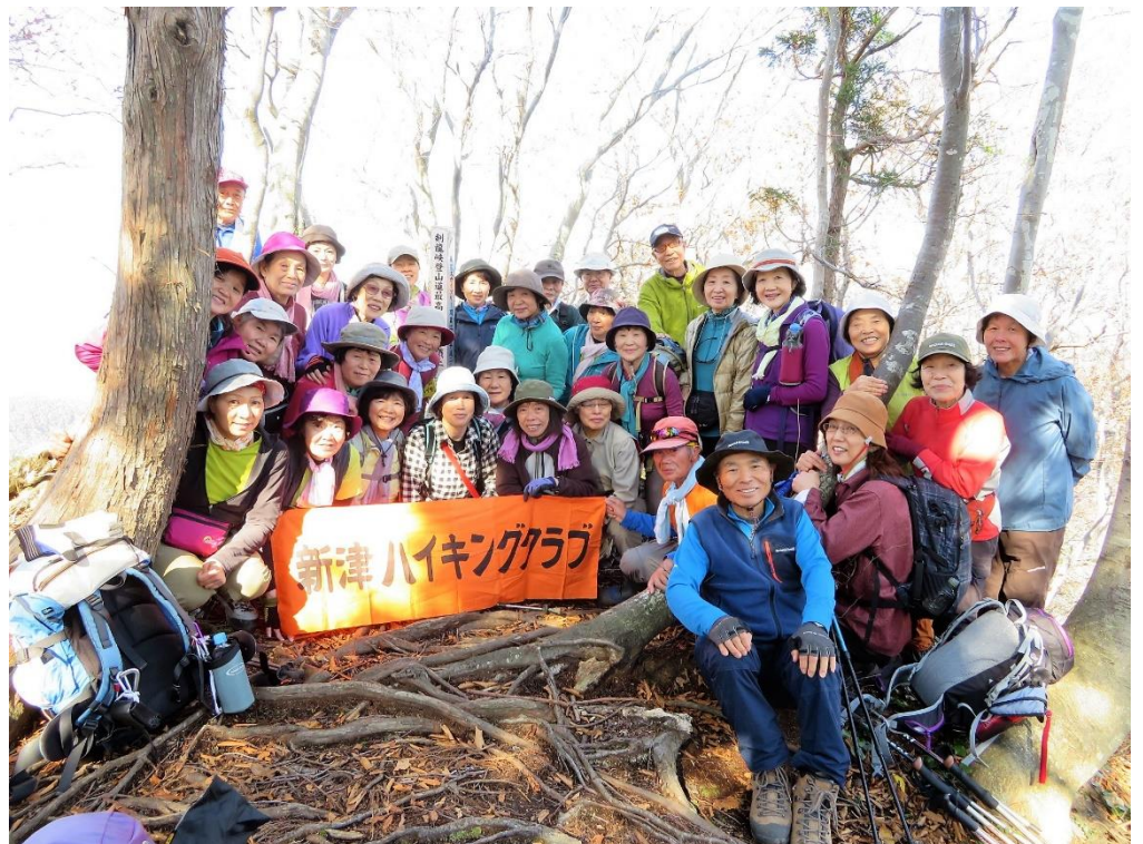
コマタ山頂で集合写真