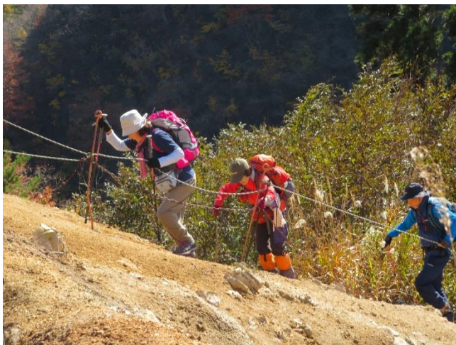
ハリ沢の鎖場。頑張ってます