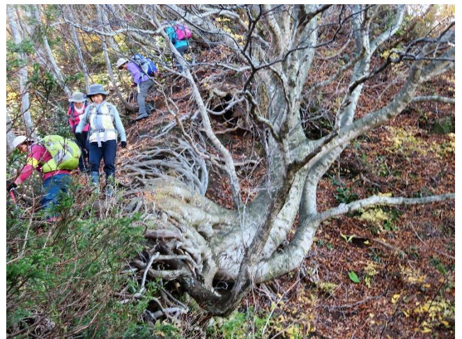
激下り 頑張るブナと仲間たち