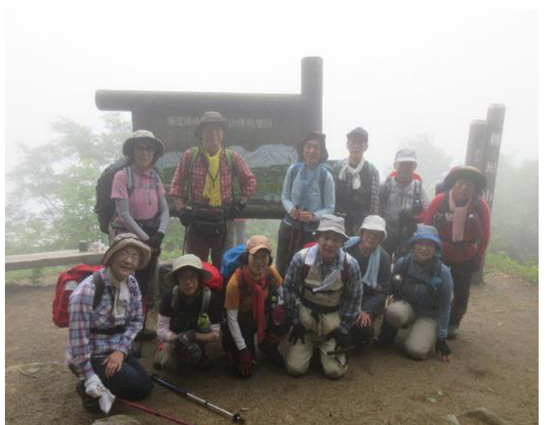
櫛形山頂、辺りはガスで見難い