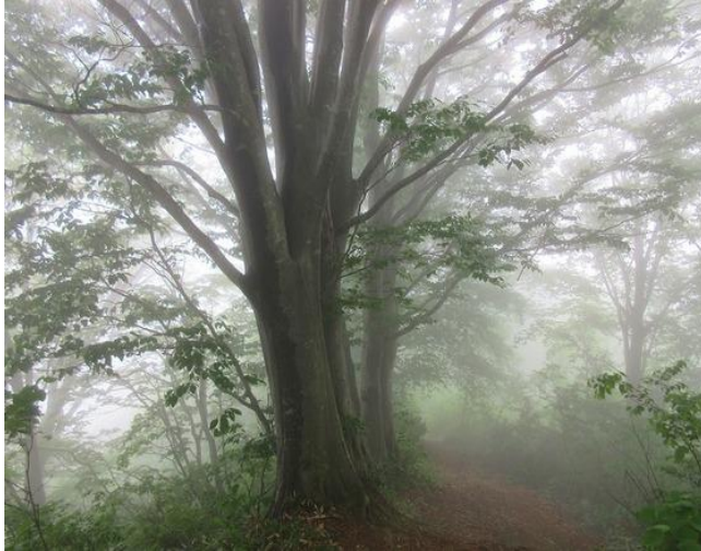
見事なブナの大木、生命力をもらおうと抱きつく