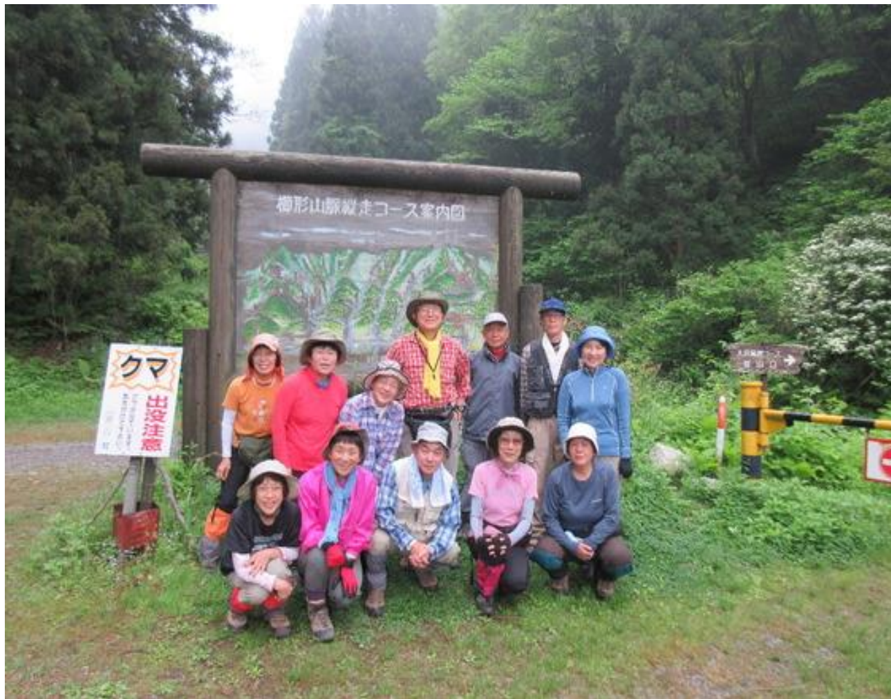
駐車場で「これから登るぞ！」と意気盛ん