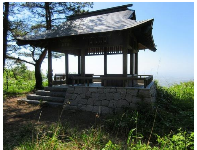
奥山荘城跡の展望楼