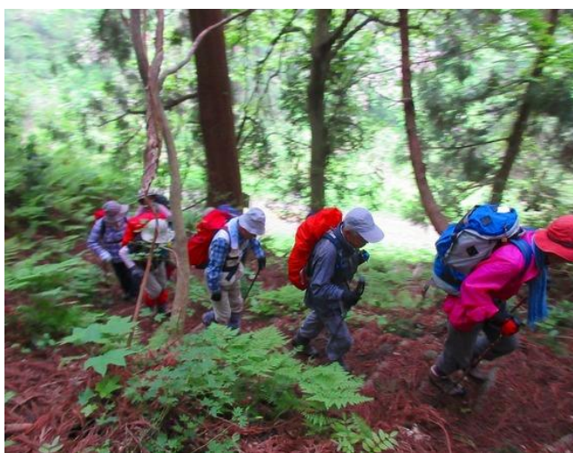
楡形山は出だしから急登が続く