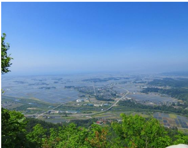
展望台から胎内平野、国道、キラキラ光る水田を見下ろす