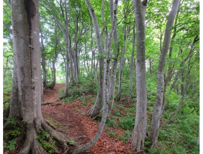
ガスが晴れてきて歩きやすい、新緑のブナ林の稜線歩き