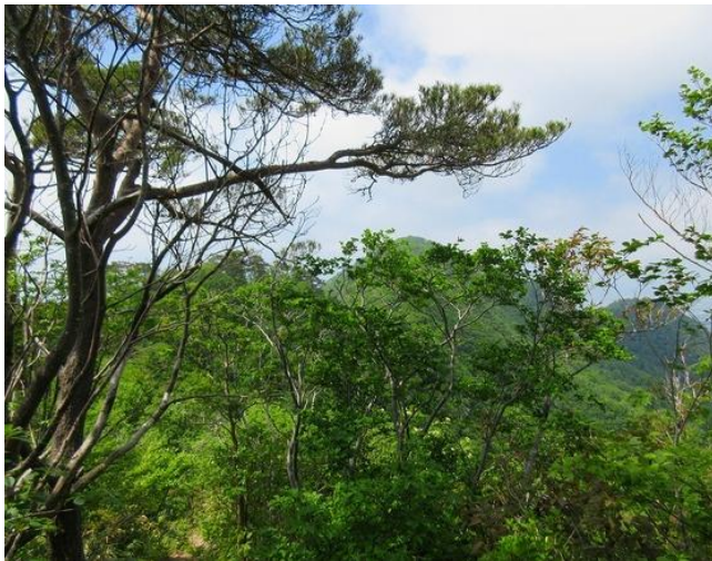
左手前ユズリハノ峰の先、鳥坂山が見えてきた