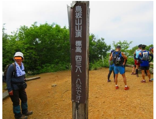
近々トレランの大会があるので、若い男女と多数行き交う