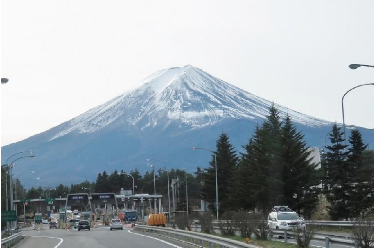
河口湖 IC から見た富士山