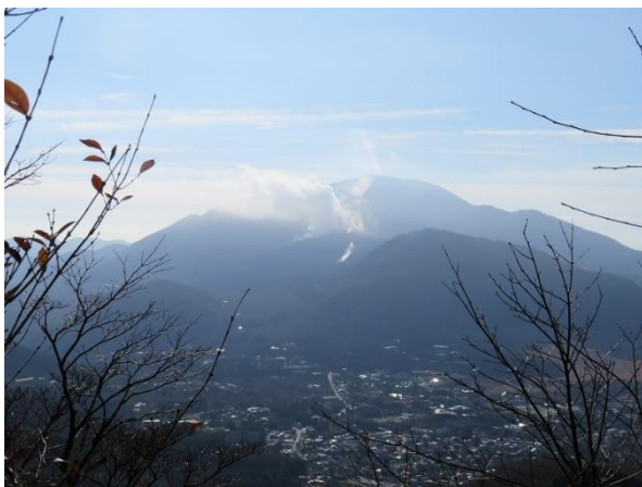
箱根の山から噴煙