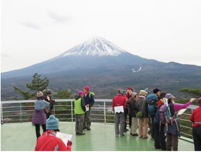
展望レストハウス