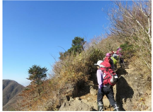
空が近いもうすぐだ