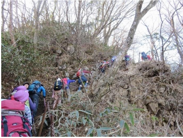
何度もアップダウン