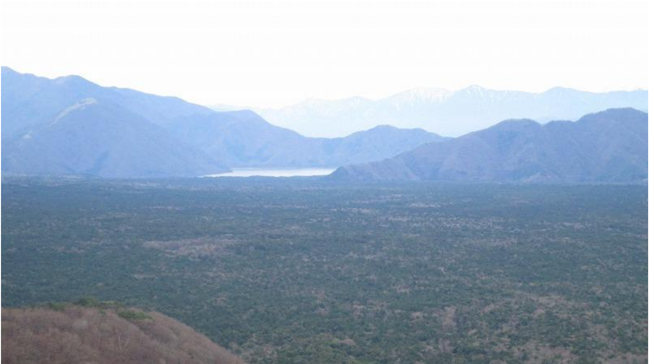
本栖湖と青木ヶ原樹海