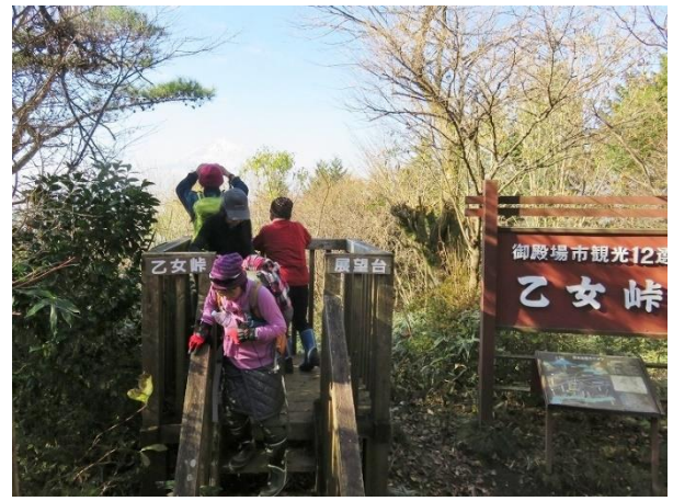
乙女峠から富士山を眺める