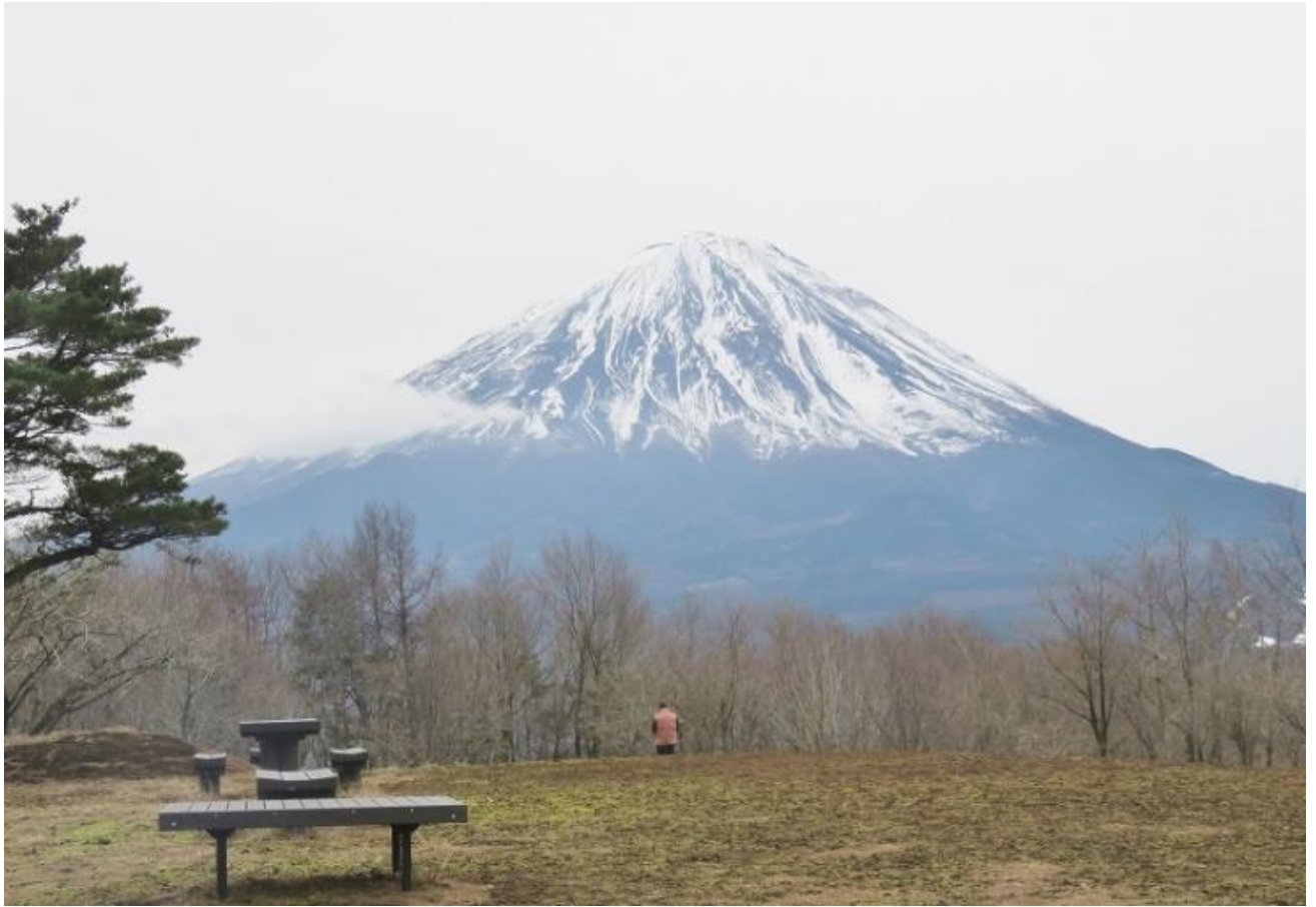
三湖台から見た富士山