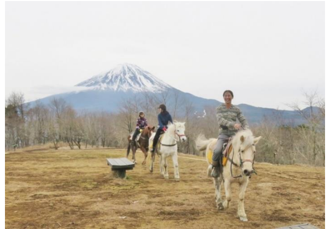
三湖台にて 木曾馬