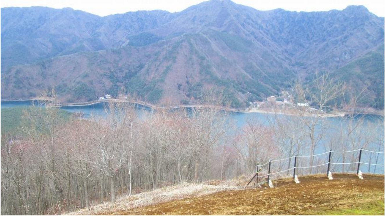
三湖台から西湖を見下ろす、中央：十二ヶ岳、右：毛無山