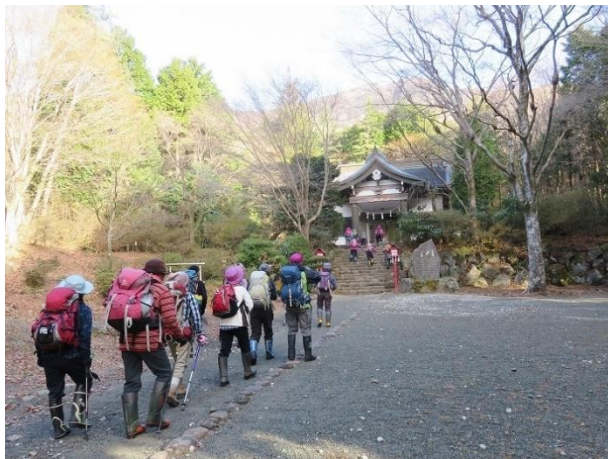
金時神社から歩き出す