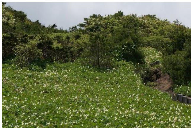
芝草平のチンギルマ