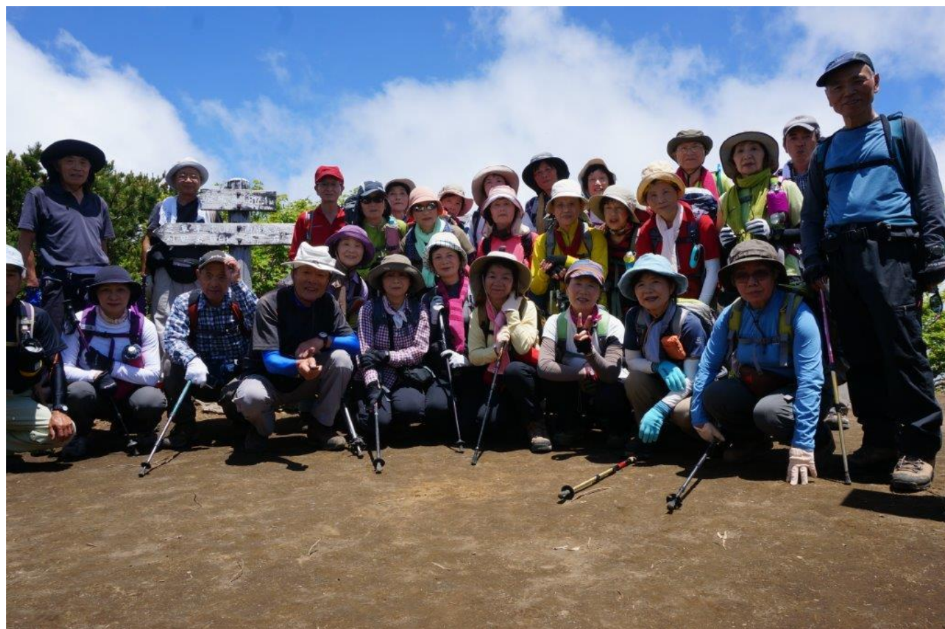
屏風岳山頂集合写真