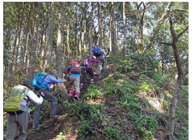
剣ヶ峰へ通じる急な登り