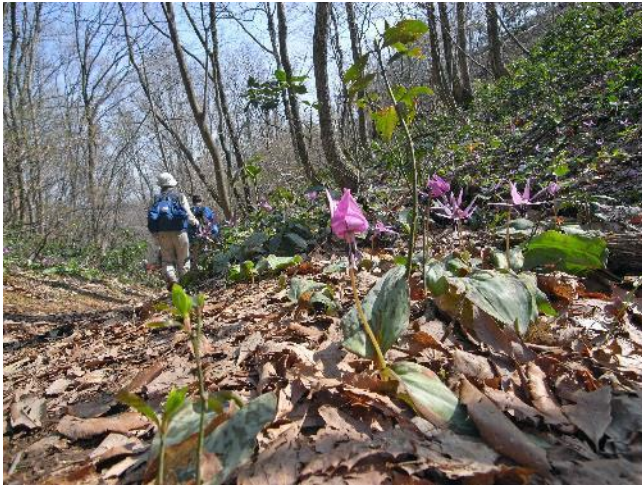
ちご道のカタクリ