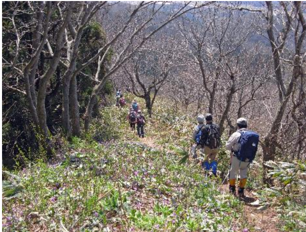
詰め城の剣ヶ峰を下る