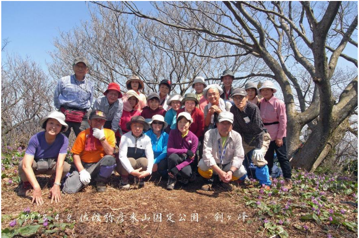
カタクリの咲く剣ヶ峰