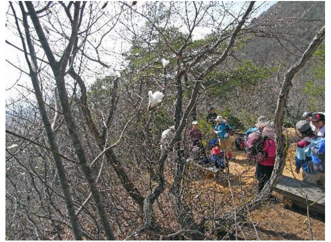
タムシバを見ながらの休憩