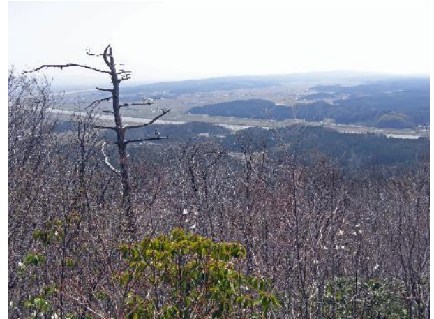
信濃川大河津分水路