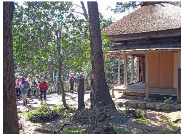
良寛が20年間住んでいた五合庵